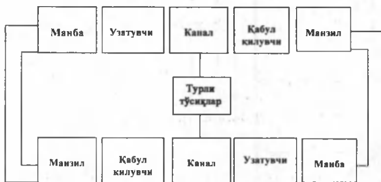
14.3-расм. М. Дефлёр модели

Ҳар бир сиёсий тизимнинг ўзига хос бўлган сиёсий коммуникация тармоқлари шаклланиб, улар сиёсий тизим имкониятлари ва ривожланиш даражасига муносиб равишда амал қилади. Хусусан, тадқиқотчилар ижтимоий-иқтисодий тараққиёт билан ОАВнинг ривожланиш даражаси ўртасида тўғридан-тўғри боғлиқлик мавжуд эканлигини очиб берганлиги фикримизнинг далилидир. Шу билан бирга, коммуникациялар билан сиёсий ўзгаришлар ўртасида ўзаро кенг нисбатлар мавжуддир. Коммуникация тизими сиёсий эволюция билан бир вақтда ривожланади.