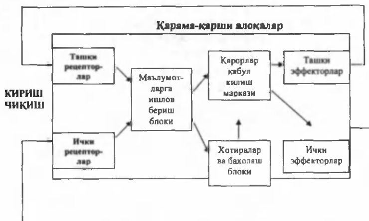
5.2-расм. К.Дойч сиёсий тизими схемаси

К.Дойч, шу билан бирга, сиёсий тизимдаги коммуникацияларнинг учта турини ажратиб кўрсатади: 1) шахсий, норасмий коммуникациялар (face-to-face), масалан, депутатликка номзоднинг сайловчилар билан табиий ҳолатдаги шахсий алоқаси; 2) ташкилот орқали коммуникациялар, яъни ҳукумат билан алоқалар партиялар ва бошқа жамоатчилик ташкилотлари воситасида амалга оширилади; 3) ОАВ (оммавий ахборот воситалари) орқали бўладиган коммуникациялар, тезлик билан ўсиб бораётган электрон воситалар.