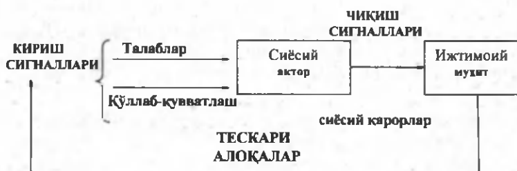
11.1-расм. Д.Истоннинг тесқари алоқалар принципи концепцияси

Сиёсий ва бошқарув қарорларининг турлари. Давлат органлари ва маҳаллий ҳокимият органлари томонидан қуйидаги бошқарув қарорлари қабул қилинади: