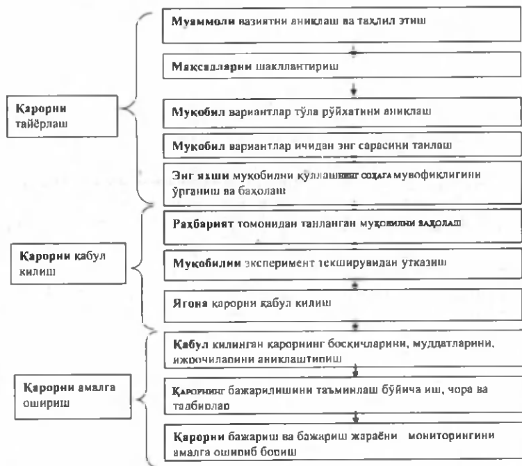
11.3-расм. Бошқарув қарорларини қабул қилиш ва амалга ошириш жараёни

Жамиятнинг эҳтиёжларига мос сиёсий қарорлар ишлаб чиқиш имкониятлари кўплаб омилларга боғлиқдир. Масалан, ҳокимиятнинг марказлашиш (ёки номарказлашиш) даражаси; давлат тузилишининг марказий ва маҳаллий органлари ҳуқуқлари ва имтиёзлари нисбати; сиёсий қарорлар қабул қилиш жараёнларига тўғридан-тўғри ёки билвосита таъсир этувчи партиявий ва