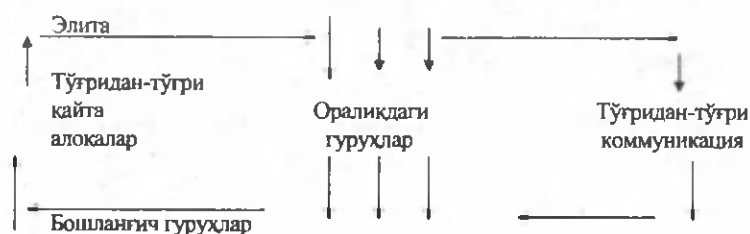
14.4.-расм. К. Сайнне модели

Сиёсий коммуникацияга таъсир ўтказишда сиёсий маданият тури ҳам муҳим аҳамият касб этади. Ва, аксинча, сиёсий коммуникация ҳам сиёсий маданиятнинг шаклланиши омили сифатида унинг ўсишига кучли таъсир этади. Сиёсий коммуникация муайян жамиятда қабул қилинган меъёрлар ва қадриятларни такрорий равишда қайта ишлаб чиқади. Жумладан, телевидениени кишиларнинг сиёсий ижтимоийлашув жараёнидаги ролни жуда ҳам каттадир. Олимларнинг ҳисоблашича, ўртача учта ва ундан ортиқ одам яшайдиган оилада яшовчилар бир ҳафта ичида олтиш бир соат вақтини телевизор кўришга сарфлар экан. Сиёсатшунос Ж. Карлсоннинг фикрича, телевидение сиёсий тизимга нисбатан айнан ўхшаш мўлжал олиши билан ажралиб туради 49 . Телевидение дастурлари девиант хулқнинг пайдо бўлишига нисбатан кўпроқ ижтимоий ва сиёсий меъёрларни кучайтириш учун имкониятлар туғдиради. Сиёсий коммуникация жараёнида бошқарувчилар билан бошқарилувчилар (ёки сиёсий тизим билан атроф-муҳит) ўртасида қарорлар қабул қилишда ҳар иккала томонларнинг розилиklarини олиш мақсадидаги ахборотлар алмашиш муҳим ўрин тутаяди. Бу жараёнда бошқарилувчилар ўз талабларини ифода этишга, уни бошқарувчиларга билдиришга ҳаракат қиладилар. Бу икки томон ўртасидаги келишув фақат коммуникация ва ўзаро мулоқотлар воситасида амалга ошириш мумкин.