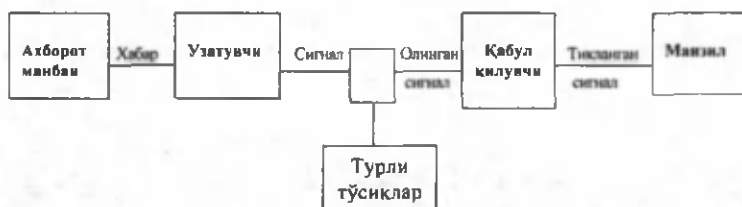
14.2-расм. Шеннон-Уивер модели

Бу жараёнда коммуникация ҳодисасининг ташаббускори икки томонлама алоқаларга киришадиган – «ахборот» тескари алоқалар канали бўйича у «хабар» сифатида тикланиб, манзилга етказадиган қабул қилувчига боради. Натижада, ташаббускор