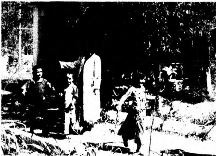
Мавзу. Ұрмон ҳайвонларидан — фил билан танишиш

Машғулот мақсади: Болаларнинг табиатга оид билимларини аниқлаб, ёввойи ҳайвонлардан бири фил билан таништириш, уларнинг номи, тана қисмлари, яшаш шароити, озиқланиши тўғрисида маълумот бериш. Ҳайвонларнинг ташқи кўринишидаги ўзига хос ва умумийликни ажратишни ўргатиш.