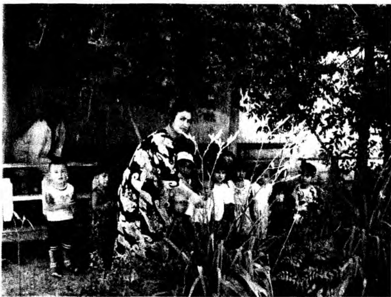
Мавзу. БОҚҚА САЁҲАТ. БАРГИГА ҚАРАБ МЕВАЛИ ДАРАХТЛАРНИ АНИҚЛАШ

Машғулот мақсади: Болаларнинг табиат борасидаги билимларини аниқлаб, дарахтлар ҳақидаги тасаввурларини бойитиш ҳамда дарахтларнинг бир-биридан фарқлари, фойдали томонларини ўрганиш.