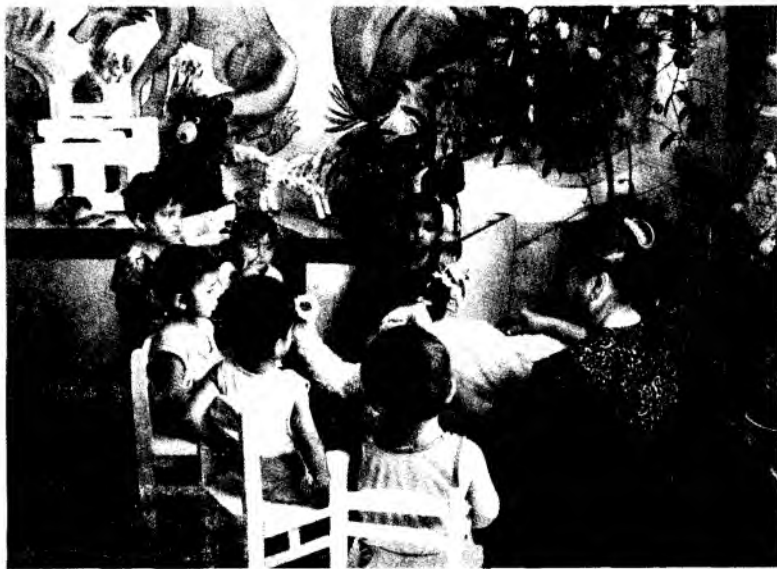
Мавзу. ХОНАКИ ГУЛЛАРАНДАН — ХИТОЙ АТИРГУЛИ БИЛАН ТАНИШТИРИШ

Машгулот сўнгига тарбиячи болаларга «Айиқ ва йўлбарс» эртагини сўзлаб беради ва болалар билан савол-жавоб ўтказиб, машгулотда олган билимларини хулосалайди. «Айиқлар асал смокда» ҳаракатли ўйинини бажарадилар.