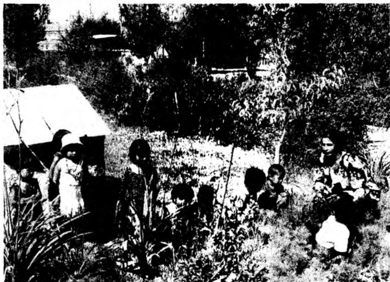
Мавзу. ТУТ, ТЕРАК, ЧИНОР, ТОЛ ДАРАХТЛАРИ БИЛАН ТАНИШТИРИШ

Тарбиячи: Баҳорда бинафша, қоқигуллар очилади. Улар табиий ўсимликлардир. Қоқи ўти — доривор хусусиятга эгадир. У инсон саломатлиги учун фойдалидир. Қоқи ўтдан баҳорда кўк сомсалар тайёрланади. Қоқи ўтни тозалаб, илиқ сув билан ювиб, туз сепиб, истеъмол қилинса, меъда-ичак касалликларига йўлиқмайди киши. (Тарбиячи болаларни табиат қўйнига олиб чиқиб, кўклам кўкатларини теришни ўргатади. Богбон ёрдамида болаларга белкуракча, хаскаш каби меҳнат асбобларини ишлатишни ўргатади. Ишлов берилган ерга биргаликда райҳон, намозшомгул, гулсапсар, гулбеор каби гул кўчатларини ўтқазишади.)