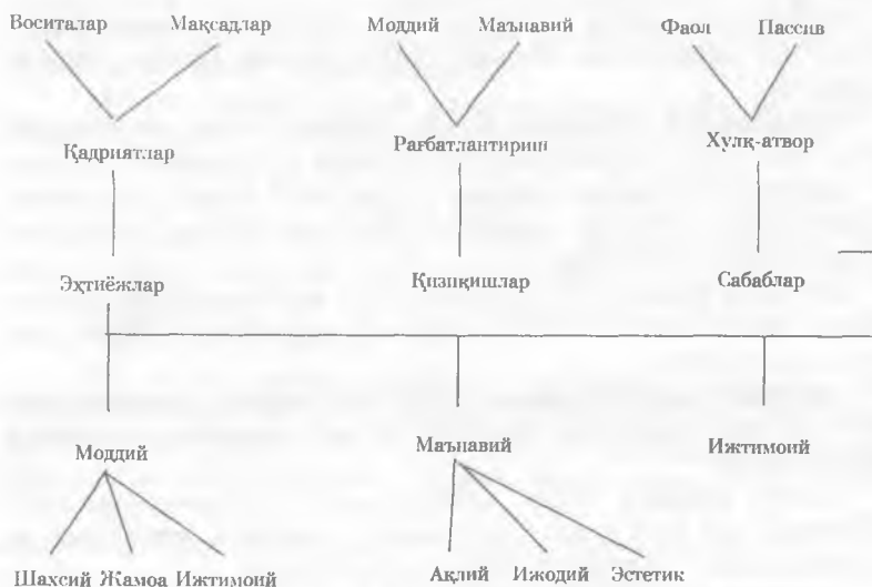
3-чизма. Меҳнат хулқ-атворини тартибга солиш сабаб механизмини таснифлаш

Куриб турибмизки, меҳнат хулқ-атворига уни ташкил этувчи турли таркибий қисмлар таъсир кўрсатади (3-чизма).