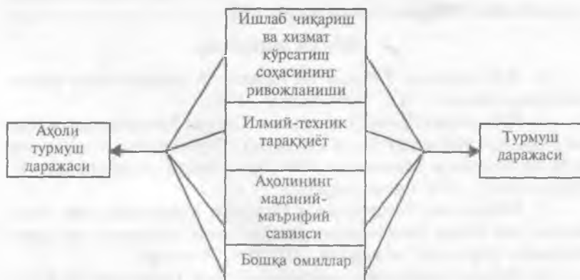
1-расм. Аҳоли эҳтиёжлари ва турмуш даражасига таъсир этувчи омиллар

Ўзбекистонда аҳолининг моддий, маънавий, ижтимоий эҳтиёжлари қондирилиш даражасини ифодаладиган «турмуш даражаси» атамаси кенгроқ қўлланилади. Бундай тавсиф кўпроқ турмуш даражаси статистикасини характерлайди. Шу билан бирга турмуш даражаси – кўплаб омиллар йиғиндиси таъсирида бўлган ўзгарувчан жараёнدير. Турмуш даражаси мунтазам ўзгариб турадиган турли неъматларга бўлган эҳтиёжларнинг таркиби ва даражаси билан, бошқа томондан, эҳтиёжни қондириш имкониятлари, товарлар ва хизматлар бозоридаги ҳолат, аҳоли даромадлари, меҳнаткашларнинг иш ҳақи билан белгиланади. Аммо иш ҳақи миқдори ҳам, турмуш даражаси ҳам ишлаб чиқариш ва хизмат кўрсатиш соҳалари самарадорлигининг кўлами, илмий-техник тараққиёт даражаси, аҳолининг маданий-маърифий савияси ва таркиби, миллий хусусиятлар, сиёсий ҳокимиятга боғлиқ (7.1 расмга қаранг).