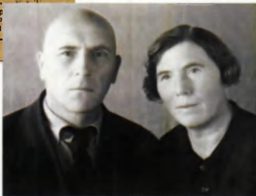
Фота Бельскіх часу Вялікай Айчыннай вайны. Бухара, 1944.

Запращальны білет на пасяджэнне вучонага савета Бухарскага педінстытута. 1942.