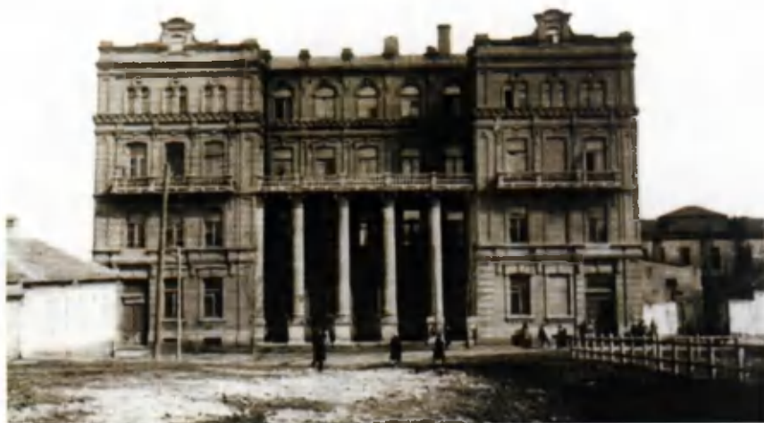
Будынак Данецкага інстытута народнай адукацыі, дзе ў 1920-я гг. працаваў Ф. А. Бельскі.