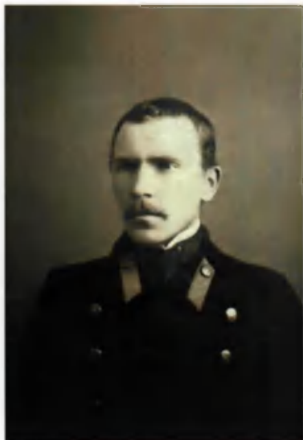
Студэнт Імператарскага ўніверсітэта св. Уладзіміра. Кіеў, 1912.