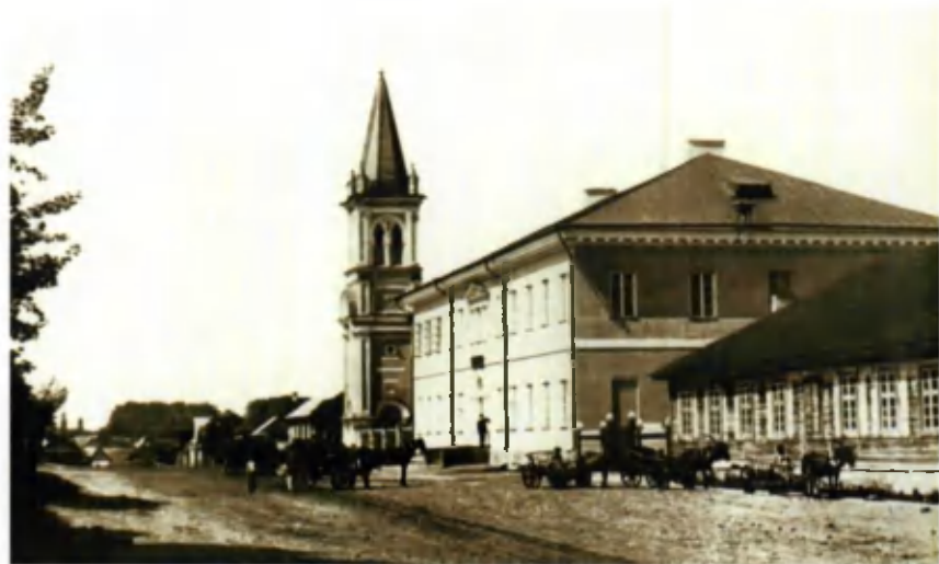
Слущкая мужчынская гімназія. Пачатак XX ст.