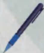
Pen Ruchka Ручка