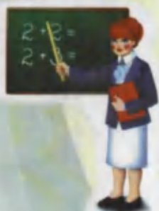
Teacher O'qituvchi УЧИТЕЛЬ