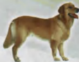
Dog Kuchuk Собака