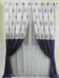
Curtain Parda Занавеска