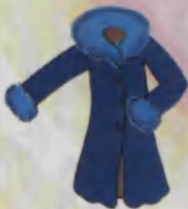
Coat Palto Пальто