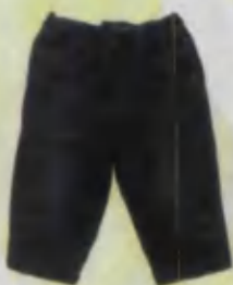
Trousers Shim Штаны