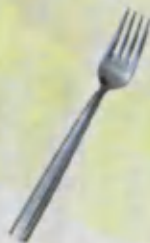
Fork Sanchqi Вилка