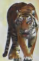
Tiger Yo'lbars Тигр