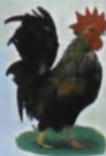
Rooster Xo'roz Петух