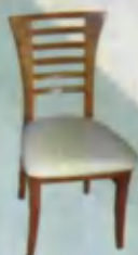
Chair Stul Стул