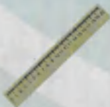
Ruler Chizg'ich Линейка