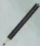
Pencil Qalam Карандаш