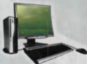
Computer Kompyuter Компьютер