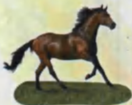
Horse Ot Лошадь