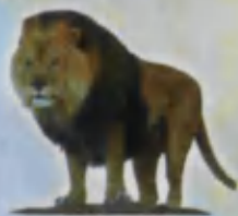
Lion Sher Лев