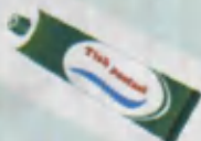
Toothpaste Tish pastasi Зубная паста