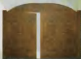
Gate Darvoza Ворота