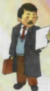
Journalist Jurnalist Журналист