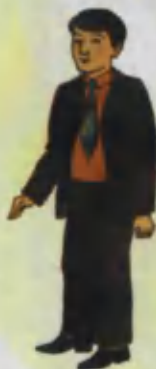
Father Ota Папа