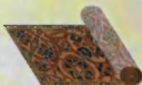
Carpet Gilam Ковёр