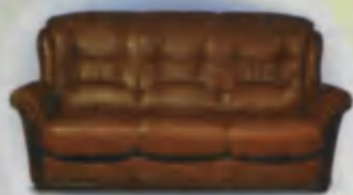
Sofa Divan Диван