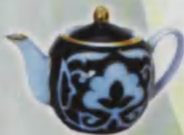
Teapot Choynak Чайник