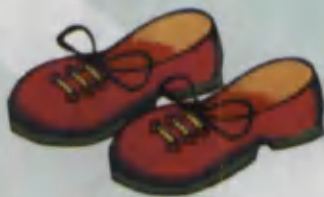
Shoes Tufli Туфли