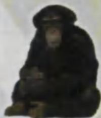
Monkey Maymun Обезьяна