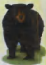
Bear Ayiq Медведь