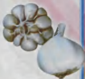
Garlic Sarimsoq piyoz Чеснок