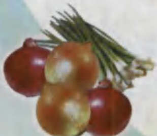
Onion Piyoz Лук