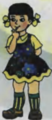
Girl Qiz bola Девочка