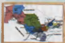
Map Xarita Карта