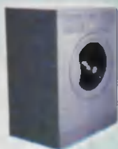
Washing-machine Kir yuvush mashinasi Стиральная машина