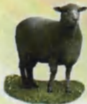
Sheep Qo'y Овца