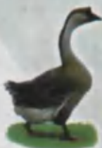
Goose G'oz Гусь