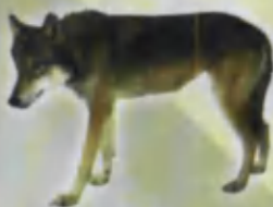
Wolf Bo'ri Волк