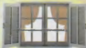
Window Deraza Окно