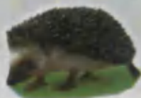
Hedgehog Tipratikon Ёж