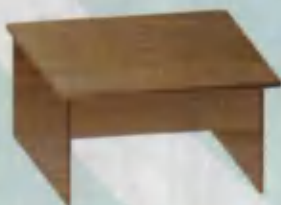
Table Stol Стол