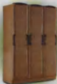
Wardrobe Kiyim shkafi Шифоньер