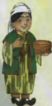
Grandmother Buvi Бабушка