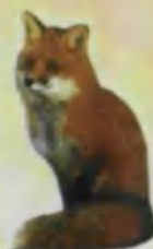
Fox Tulki Лиса