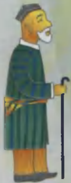
Grandfather Bobo Дедушка