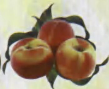
Peach Shaftoli Персик