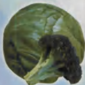
Cabbage Karam Капуста