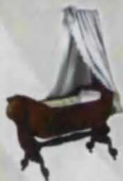
Cradle Belanchak Колыбель