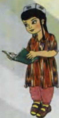
Sister Ora-singil Сестра