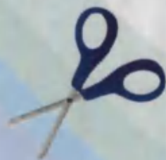
Scissors Qaychi Ножницы