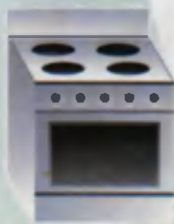
Gas cooker Gaz plitasi Газовая плита