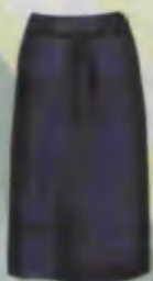
Skirt Yubka Юбка