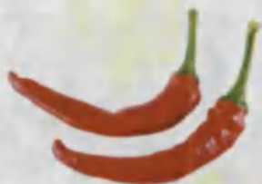
Pepper Qalampir Перец