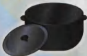
Pot Qozon Котёл