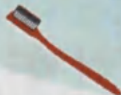
Toothbrush Tish cho'tkasi Зубная щётка