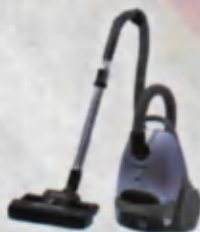
Vacuum cleaner Chang yutgich Пылесос