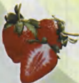
Strawberry Qulupnay Клубника