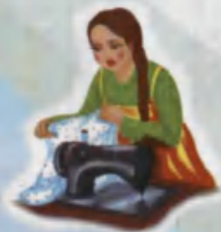
Seamstress Tikuvchi ШВЕЯ