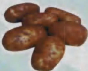
Potato Kartoshka Картошка