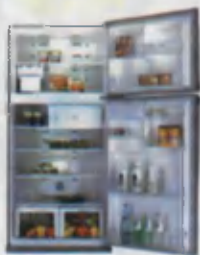
Refrigerator Muzlatgich Холодильник