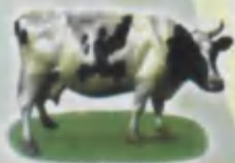
Cow Sigir Корова