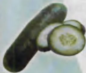
Cucumber Bodring Огурец