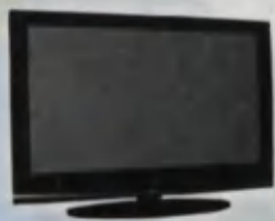
Television set Televizor Телевизор