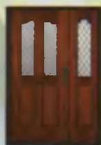
Door Eshik Дверь