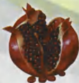
Pomegranate Apor Гранат