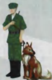
Frontier-guard Chegarachi ПОГРАНИЧНИК