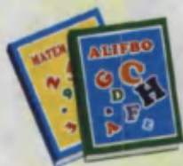
Book Kitob Книга