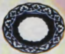
Plate Likorch Тарелка