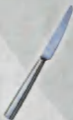
Knife Pichoq Нож