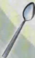
Spoon Qoshiq Ложка