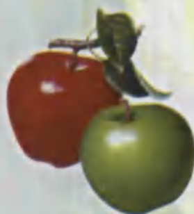
Apple O'lma Яблоко