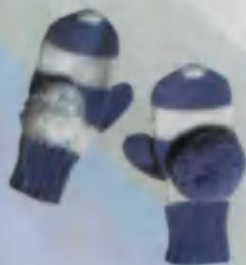
Mittens Qo'lqop Варежки