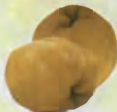
Quince Behi Айва