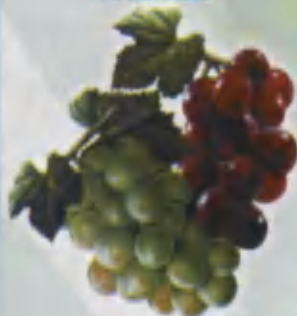
Grapes Uzum Виноград