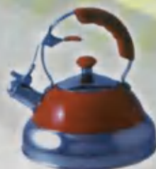
Kettle Choygum Чайник