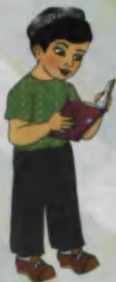
Brother Aka-uka Брат