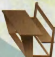
School desk Parta Парта