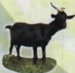
Goat Echki Козанк