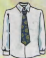
Shirt Ko'yulak Рубашка