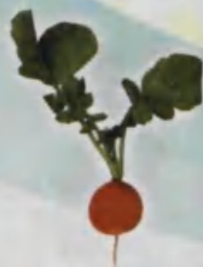
Radish Rediska Редиска