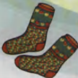
Socks Pauroq Носки