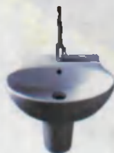
Sink Rakovina Раковина