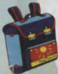
School bag Portfel Портфель