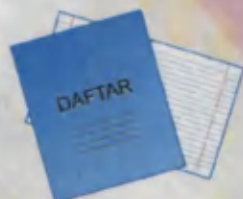
Copy-book Daftar Тетрадь