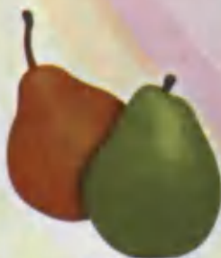
Pear Nok Груша