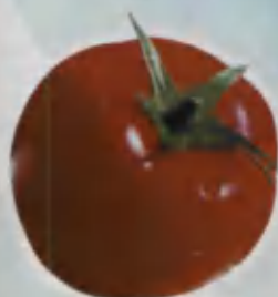
Tomato Pomidor Помидор