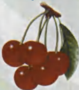
Cherry Olcha Вишня