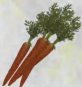
Carrot Sabzi Морковь