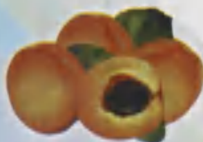
Apricot O'rik Абрикос