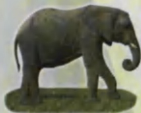
Elephant Fil Слон