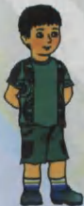
Boy O'g'il bola Мальчик