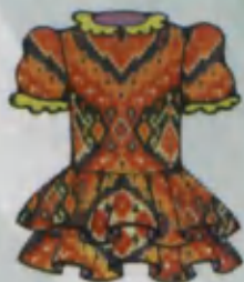
Dress Ko'yulak Платье