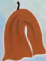
Towel Sochiq Полотенце