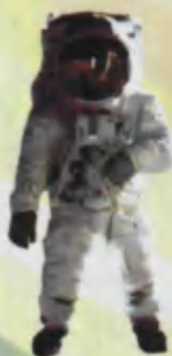
Cosmonaut Fazogir КОСМОНАВТ