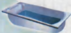
Bathtub Vanna Ванна