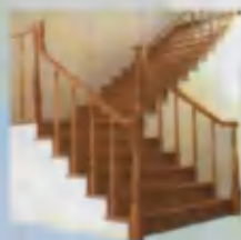
Stair Zinaroya Лестница