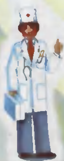
Doctor Shifokor ВРАЧ