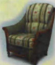
Armchair Kreslo Кресло