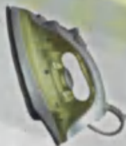
Iron Dazmol Утюг