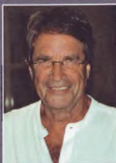
Тён ван ДЕЙК

Один из выдающихся современных лингвистов, занимающихся проблемами социальной и политической обусловленности языковых явлений. Ван Дейк является представителем критического дискурс-анализа, к появлению и развитию которого имеет непосредственное отношение. Автор более 250 статей и около 60 монографий по социолингвистической и дискурс-аналитической проблематике, принесших ему мировую известность, среди которых: «Текст и контекст. Исследования в области семантики и прагматики дискурса» (1977), «Расизм и пресса» (1992), «Идеология» (1998), «Общество и дискурс. Как социальный контекст влияет на речь» (2008) и др. Основатель и редактор влиятельных отраслевых журналов Discourse and Society , Discourse Studies , Discourse and Communication . Член редколлегии около 20 крупных европейских и американских научных периодических изданий в области лингвистики, коммуникативистики, социальной теории и культурологии.