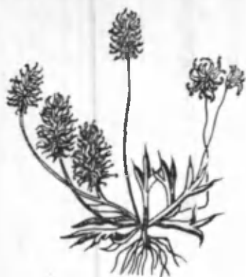
37- расм. Учма.

бери ишлатилиб келинмоқда. У билан тери касалликларини, айниқса қўтир ва яраларни даволаб келганлар. Учма чорва моллари учун гуллаш даврида жуда заҳарли ҳисобланади. Айниқса, ана шу даврда қўй ва эчкилар заҳарланиб ўлади. Усимликнинг заҳарли бўлиши таркибидаги протоанемоние алкалоидига боғлиқдир. Усимлик таркибида 0,026% алкалоидлар бўлиб, улар тезда реакцияга кирувчи жуда актив моддалардан иборатдир. Ўзбекистонда учманинг икки тури, айниқса тарқалган, бирини оташак деб аталади. Умумий