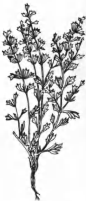
32- расм. Бозулбанг.

БОЗУЛБАНГ ( Lagechilus inebrians Vge.) лабгулдошлар оиласига мансуб, бўйи 20—60 см келадиган кўп йиллик ўт (32-расм). Пояси асосидан ёғочланган, тик шохланган, қаттиқ тукчалар билан қопланган. Улар тушиб кетгандан кейин ўрнини оқ, ялтироқ пўстлоқ эгаллайди. Барги бандли, тухумсимон, думалоқ ёки деярли елпигичсимон, тўмтоқ, асоси понасимон, бўлакли, барг чети бутун ёки бўлакчали, сертуклидир. Гуллари ўтроқ, юқори барг қўлтиқларида 4—6 тадан жойлашган. Ён барглари уч қиррали, бигизсимон, тиканли, туклар билан қопланган. Гултожи 20—28 мм узунликда, оқ ёки пушти рангли, томирчалари жигар рангдадир. Ёнғоқчалари туксиз, 4—5 мм катталиқда. Бозулбанг июнь-июль ойларида гуллайди ва уруғи июль-сентябрь ойларида етилади. Бу ўсимлик Самарқанд, Қашқадарё, Сурхондарё вилоятларининг адирларида ва тоғ этакларидаги шағал тошли жойларда тарқалган. Бозулбанг халқ табоба-