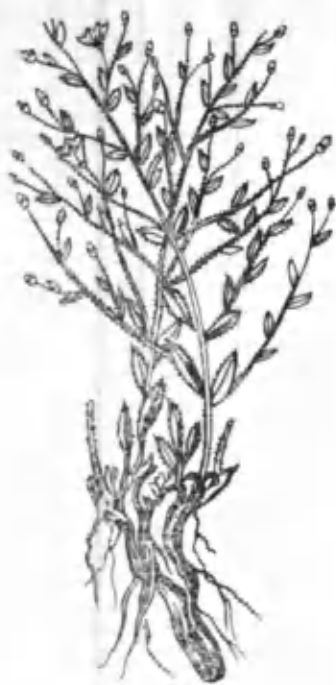
14- расм. Партак.

лумотлар олиш мумкин. Чучмома-нинг ҳаёти (биологияси) ни ҳали тўлиқ ўрганилмаган деб ҳисоблаш мумкин. Айниқса, у умрида бир марта гуллайдими ёки ҳар йили гуллайдими? Бу ноаниқ, текшириш керак.