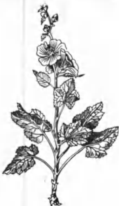
38- расм. Оқгулхайри.

рида, дарё қирғоқларида ҳамда дарахтлар тагида ўсади. Улар адир ва тоғ минтақасида кенг тарқалган. Толали гулхайри июль-август ойларида гуллайди ва уруғи июль-сентябрь ойларида етилади. У манзарали ўсимлик бўлиб, асалчилдир. Уларнинг айрим турларидан дори-дармон сифатида турли хил ички касалликларни даволашда фойдаланиш мумкин. Ўсимлик органларида 35% даволаш хусусиятига эга бўлган ёпишқоқ суюқлик, 2% дан ортиқ ошловчи моддалар, эфир мойи, шакар, крахмал ва уруғида ўсимлик мойи бўлади. Бу ўсимликлардан тўқимачилик ва озиқ-овқат саноатида фойдаланиш мумкин. Гулхайриларнинг барча турлари тола берувчи ўсимликлар бўлиб, поясида унинг оғир-