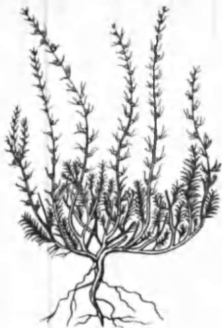
19- расм. Изень.

расм). Барглари майда, поя ва ён шохчаларида навбатлашиб жойлашган. Пояси асосидан жуда кўп ён шохчалар ҳосил қилади. Изень март ойида кўкаради. У ён шохчалар, новдалар ҳосил қилиб, узоқ вақт ўсади. Июнь ойида гуллайди. Гуллари майда, оқиш бўлади. Гултожи гулкосасидан чиқиб туради. Гуллари поя, шохлар бўйлаб барг қўлтиғида жойлашади. Уруғи сентябрь-октябрь ойларида пишади. Уруғи қанотчали, қўнғир тусда бўлади. У уруғидан яхши унади. Изень уруғини (ноябрда) ёки эрта баҳорда (февралда) экиш мумкин. Уруғнинг устини тупроқ билан кўмиш ярамайди. Чунки уруғи тез чириб, униш қобилиятини йўқотади. Республикамининг кўпгина областларида, айниқса, Андижон, Наманган, Самарқанд областларида кўп ўсади. У чорванинг тўйимли озиги ҳисобланади. Ҳозир унинг агротехникаси тўлиқ ишлаб чиқилган. Биологияси ўрганилган. Изень билан шуғулланадиган Самарқанд область Нурота районида Ўзбекистон Фанлар академияси ботаника институтининг Нурота тажриба станцияси ташкил этилган. Изень ҳозирги кунда республикамининг қоракўлчилик совхозлари яйловларига экилмоқда.