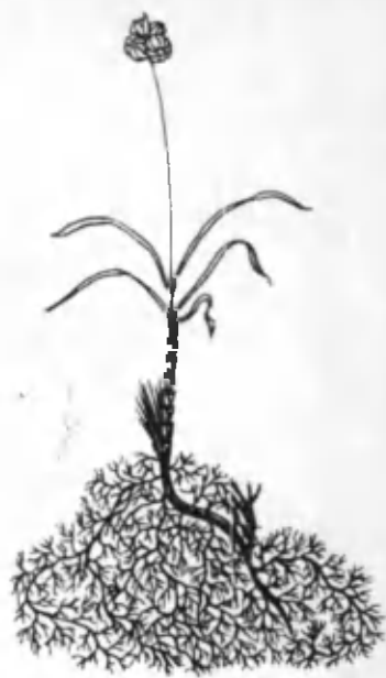
12- расм. Илоқ.

ҚИРҚАСОЧ ( Iris songorica Schrenk.) савсаргулдошлар оиласидан, бўйи 30—60 см га етадиган кўп йиллик ўсимлик (13- расм). Барглари ясси, қиличсимои, поясининг тубига икки қатор бўлиб тўпланган. Қирқасоч март ойида кўкаради. Бир тупидан 60—80 тагача ва ундан ҳам кўп лентасимон барглрар чиқаради. Орадан бир ой ўтгач, поялари ўсиб чиқади. Пояси одатда баргсиз, баъзан барглари асосидан нов шаклида ўраб туради. У апрель ойида гуллайди. Гуллари оқиш бинафша, гултожи