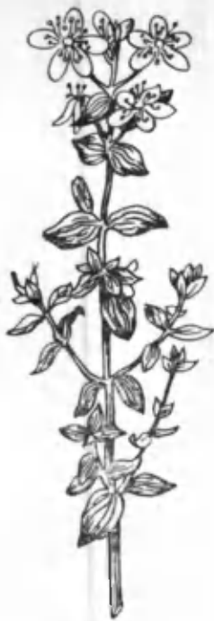
31- расм. Чойўт.

симон, тўпгуллари чўткасимон-рўвак ёки юмалоқ-тухумсимон шаклда бўлади. У адир минтақасидан бошлаб тоғ минтақасининг ўрта қисмигача бўлган жойларда турли шароитга мослашган ҳолда учрайди. Чойўт май-август ойларида гуллайди, июль-сентябрь ойларида эса уруғи пишади. Чойўтнинг шифобахшлиги жуда қадимдан маълум. Шу сабабли халқимиз чойўт 99 дарднинг давоси деб бежиз айтмаган. Унинг ер устки қисмидан жигар, ошқозон, шамоллаш каби касалликларни даволашда ҳамда буриштирувчи ва сийдик ҳайдовчи восита ва бўёқ сифатида фойдаланганлар. Бу ўсимликнинг барги, новда ва тўпгуллари, айниқса гуллаш даврида дори-дармонлик хусусиятига эга бўлиб, улардан тиббиётда ошқозон-ичак, жигар, йўтал, яра, зотилжам касалликларини даволашда, қон кетишини тўхтатишда дори-дармон (шарбат ёки препарат) сифатида фойдаланилади. Чойўтдан антибактериал хусусиятга эга бўлган иманин ҳамда оксилли препарат гиптальбин тайёрланади. У шикастланган тўқимани тиклайди. Баъзи маълумотларга қараганда, чойўтдан олинган шарбат вена қон томирига