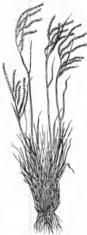
42- расм. Чалов.

майди. Сернам йиллари ўриб пичан қилинса, гектаридан 200 кг гача қуруқ хашак олиш мумкин.