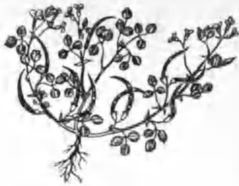
40- расм. Сарикйўнғичқа.

етади (39- расм). Қилтиқ март ойида кўкаради. Кўклигида қўй ва эчкилар хуш кўриб ейди. Қуригач (июнь ойида) қилтиқ дағаллашади ва шу сабабли чорва моллари уни деярли емайди. Қилтиқ қуриган ҳолда айниқса қўзилар учун хавфлидир. Қилтиқни хашак қилиш учун фақат эрта кўкламда ўриб олиб бошқа ўтлар билан аралаштириш керак.