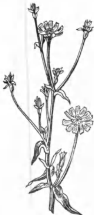
33- расм. Сачратқи.

Гуллари пояда ҳалқасимон жойлашган. Ён барглари бизгизимон, бир оз қайрилган бўлиб, майиндир. Косачанинг учи учбурчакли, тиканга айланган. Гултожи 12—13 мм узунликда бўлиб, оч қизил ёки тўқ пушти ранглидир. Арслонқулоқ июнь-июль ойларида гуллаб, уруғи июль-август ойларида пишади. У дарахт ва буталар орасида, йўл атрофларида, тоғнинг ўрта қисмигача бўлган жойларда (ариқ ва булоқлар бўйида) кўп-кўп учрайди. Арслонқулоқдан тайёрланган қайнатмадан ошқозон ва юрак оғриқларини ҳамда асаб касалликларини даволашда фойдаланилади. Бу ўсимликнинг ер устки қисмларининг таркибида леопурин деган аччиқ модда, 5—8% танид, сапонин, алкалоид, 0,1—0,2% эфир мойи ва минерал тузлар бор.