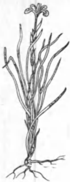
13- расм. Қирқасоч.

гулкосасидан чиқиб туради. Гулқўрғони 6 та гултожибаргдан иборат. Булардан учтаси бир хил, яна учтаси бошқа хил кўринишда. Бундан ташқари, дастаси уч бўлакли бўлиб, кўриниши гултожсимон бўлади. Меваси июнь ойида пишади. У чатнаганда паллаларга бўлинади. Меваси уч қиррали чаноқчадан иборат. Уруғи силлиқ, туксиз, қўнғир рангда бўлиб, шу чаноқча ичида қават-қават бўлиб жойлашади. Меваси поясида узоқ вақт сақланади. Уруғидан яхши кўпаяди. Қирқасоч республикамининг кўпгина областларида, хусусан, Самарқанд областининг Нурота, Бухоро областининг Кенимех, Навоий районларида бир неча минг гектар ерларни эгаллайди. У ерларда ўсимликлар қопламининг асосий қисмини ташкил қилади. Қирқасоч илдизи ҳам чим ҳосил қилади, унинг диаметри 60—80 см га етади. Ундан чўтка тайёрлашда кенг фойдаланилади. Унинг қуриб қолган баргларида арқон тўқишади. У чорванинг тўйимли озиқларидан ҳисобланади. Унинг қуриган баргларини моллар жуда хуш кўриб ёйди.