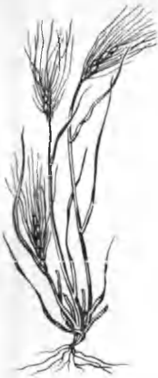
39- расм. Қилтиқ.