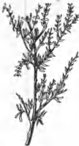
3- расм. Боялиш.