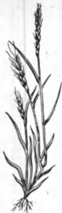
24- расм. Бугдойиқ.

ТОҒОТҚУЛОҚ ( Rumex confertus Willd.) то- рондошлар оиласидан, бўйи 85—120 см кела- диган кўп йиллик ўсимлик. Пояси тик чизиқ- ли, йўғонлиги 10 мм. Илдиз олди барглари узун баргли, барги бандига тенг, учбурчак-ту- хумсимон, бўйи 20—30 см, эни 5—15 см. Поя- даги барглари анча майда, тухумсимон ёки наштарсимон шаклда бўлади. Тоғотқулоқ март-апрель ойида кўкаради. Дастлаб илдиз олдидан узун ва камбарг новдалар ҳосил бўлади. Кейинчалик бу новдалар учидан кўп миқдордаги гуллар йиғиндисидан иборат рў- ваксимон тўпгуллар ҳосил бўлади. У май ойи- да гуллайди. Гуллари кўримсиз бўлиб, сар- ғиш-яшил рангли 6 дона гултожибаргдан иборат. Меваси июнь ойида пишади. У уч қиррали ёнғоқчага ўхшайди. Уруғидан яхши унади. Илдизи йўғон, тармоқланган, ерга анча чуқур киради. Тоғотқулоқнинг илдизидан ошловчи модда ва бўёқ олиш мумкин. Унинг барглари эса то поя бергунча овқатга ишла- тилади. Тоғотқулоқ республикамизнинг зах жойларида, тоғлар атрофида кўп ўсади.