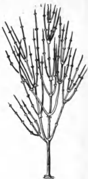
44- расм. Боржоқ.