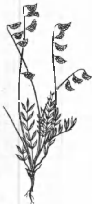
26- расм. Эспарцет.

СКАБИОЗА ( Scabiosa songorica Schrenk) тўнғизтароқдошлар оиласидан, бўйи 30—90 см келадиган 5—7 бўғимли кўп йиллик ўсимлик. Пояси сийрак тукли, қаттиқ. Илдизолди барглари наштарсимон, узунлиги 20—30 см, бандли, барги анча кичик, поядаги барглари бандсиз, патсимон бўлинган. Скабиоза март-апрель ойларида кўкаради. Илдизи кўп томрли бўлиб, қорамтир-қўнғир тусда. У июнь-июль ойларида гуллайди. Гултўплами 3—5 см катталиқда. Баргчаларининг узунлиги 12—15 мм, остки қисми узун, оқ тукчалар билан қопланган. Гултожи кул ранг-қизғиш, пушти ёки бинафша рангли. Меваси июль-август ойларида пишади. Уруғи кичик, юмалоқ, туксиз, уруғидан яхши унади. Скабиоза майда шағалли бўзтупроқда яхши ўсади. У адир минтақасидан тоғ минтақасигача кенг тарқалган. Уни чорва моллари йил бўйи яхши ейди. Республикамизда скабиозанинг 7 тури ўсади. Улар чўл минтақасидан юқори тоғ минтақасигача учрайди.