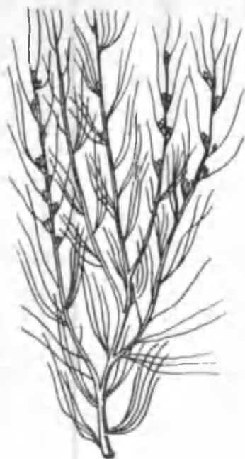
1- расм. Черкез.

зида жойлашган; қанотчалари шамол ёрдамида осонлик билан тарқалишга имкон беради. Моллар хуш кўриб ейди. Черкезнинг новда ва барглари таркибида дармондори сифатида ишлатиладиган сальсолин алкалоиди бор. Баргидан жун матоларни бўйаш учун бўёқ олиш мумкин, яшил новдаларини ёндирганда кулида поташ ҳосил бўлади. Чўлда яхши ўсадиган бу ўсимликлар кўп томонлама фойда келтиради. Шу сабабли уларни яна чуқурроқ ўрганиш болаларни Мичуринача иш кўришга ўргатиш, чўлларимизни серўт, серҳосил қилишга ёрдам беради.