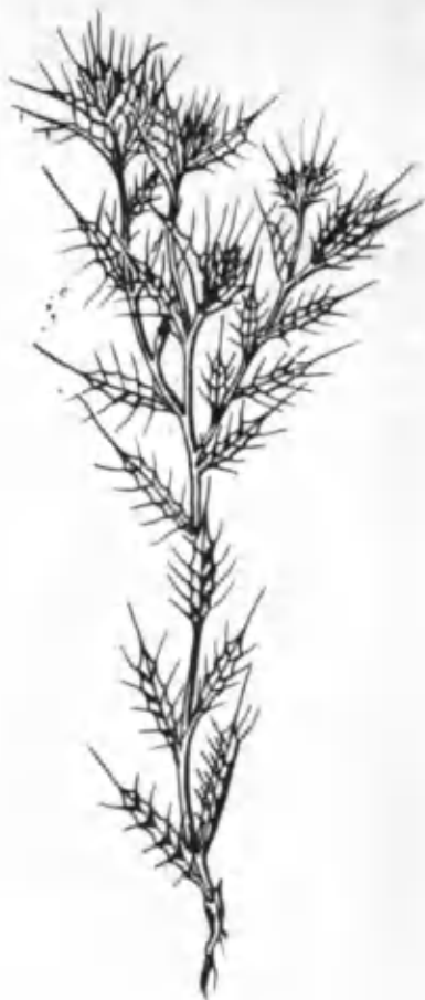
43- расм. Қушқўнмас.

ШУВОҚ ( Artemisia L.) жумҳуриятимиз яйловларида ем-хашак бўладиган шувоқнинг ўндан ортиқ тури мавжуд. Улар чўл, адир ва тоғ минтақаларида ўсади. Шувоқлар (ёвшон, шеролгин, оқшувоқ, жусан, қоражусан ва бошқалар)нинг ҳаммасини моллар, айниқса, қорақўл қўйлари кеч куз ва қишда хуш кўриб ейди. Танасида ёқимсизроқ ҳидли эфир мойи бўлганлиги сабабли, уни моллар баҳор ва ёз давомида унча емайди. Ўзбекистоннинг барча жойида шувоқни қишки хашак сифатида йиғиштириб, ҳар бир отарда етарли миқдорда тайёрлаб олинади. Чўл ва адир минтақасида ўсадиган шувоқ, айниқса куз ва қиш фаслида қорақўл қўйлари яйловларда ейдиган энг яхши озиқ ҳисобланади. Ўтказилган тадқиқотлар шувоқ таркибида оқсил ва бошқа моддалар ниҳоятда кўп эканлигини кўрсатди. Масалан, О. И. Морозовнинг таъкидлашча, ўсиш даврида шувоқнинг кўк поясида 16,85% протейн, 15,95% оқ-