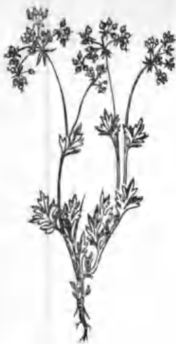
22- расм. Чўлсабзи.