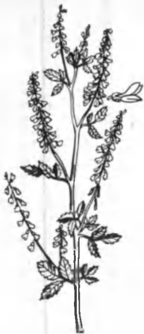
35- расм. Қашқарбеда.

натма иситма касаллигини даволашда ишлатилади. Баргларидан тайёрланган талқондан яраларни даволашда фойдаланилади. Фармацевтикада турли дорилар тайёрлашда қўлласа бўлади. Болгарияда ўсимлик шарбати чипқон, қулоқ оғриғи, мигрен ҳамда қон босимига қарши воcита ҳисобланади. Қашқарбеданинг ер устки органларининг таркибида 398 мг % С, 45 мг % Е витаминлари, 8,5 мг % каротин, 0,25 % мелилотин-глюкозид, кумарин, холин, танид ва флавоноли глюкозид бўлади.