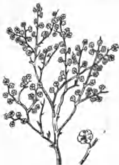
4- расм. Чўгон.

июль ойларида гуллайди. Гул тўплами бошоқсимон. Гулқўрғонининг баргчалари пардасимон, сарғишроқ ёки бинафша рангда бўлади. Меваси август-сентябрь ойларида пишади. У қанотчали, қанотлари бир-бирининг устига ёпишган, юпқа пардасимон. Унинг уруғи яхши унади. Боялиш республикамизнинг ҳамма областларида, қумтупроқли ерларда, баъзан шўрланган қумтупроқларда ҳам ўсади. Уни чорва моллари ёзда ҳам, йилнинг қолган фаслларида ҳам яхши ейди.