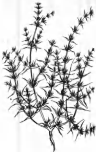
41- расм. Саған.

лашўр, қуёнжун ва бошқалар киради. Камсув ва серсув шўра ўтлар поя ва баргларида сувнинг кўп ёки камлиги билан бир-биридан фарқ қилади. Буларнинг баъзиларини (саған, қуморчиқ) моллар кўклигида хуш кўриб ейди, қуригандан кейин эса унча иштаҳа билан емайди. Чунки поя ва барглари қуриганда дағаллашади.