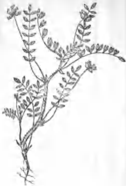
23- расм. Нўхатак.

лари нов шаклида пояни ўраб туради, пасткилари бандли. Илдизи цилиндрсимон, ўқилдиз. Март ойида униб чиқади. Май ойида гуллайди. Гуллари оқ рангли бўлиб, соябонсимон тўпгул ҳосил қилади. Соябон ўртасида этли, қизғиш мумсимон тугмача жойлашиб, ундан ҳар томонга 10—15 нурсимон кичик соябончалар тарқалади. Мевасининг эни 4,5—5 мм, четлари оқ. У уруғидан яхши униб чиқади. Чўлсабзи республикамизнинг ҳамма областларида учрайди. Айниқса, лалмикор, ғалла экиладиган ерларда кўп ўсади. Уни чорва моллари хуш кўриб ейди. Унинг биологияси ҳали тўлиқ ўрганилмаган.