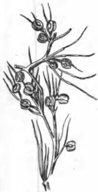
10- расм. Қизилқандим.

ҚУЁНСУЯК ( Ammodendron conollyi Bge.) дуккакдошлар оиласидан, бўйи 4—6 м га етадиган дарахт ёки бутадир. Барглари ялтироқ-қумуш рангли, майин, узунлиги 2—5 см, эни 3 мм бўлади. Битта умумий тиканли барг бандига иккитадан барг ўрнашган. Қуёнсуяк март ойида кўкаради. Унинг пояси тик ўсади. Кўкарганда ён шохчаларда куртаклар униб, ундан барг ва новдалар ҳосил бўлади. У апрель-май ойларида гуллайди. Гуллари бинафша рангли, хушбўй, чиройли, шакли ва катталиги оқ акациянинг гулига ўхшаш бўлиб, кўп гулли шода ҳосил қилади. Меваси июнь-июль ойларида пишади. Унинг дуккаги парраксимон, узунлиги 30—35 мм, эни 5—7 мм, чўзинчоқ-лентасимон, туксиз уч ва туб қисми қисқа учли бўлади. Уруғи қўнғироқ тусда. Илдизи ерга анча чуқур киради. У қумларни мустаҳкамлашда муҳим аҳамиятга эга. Унинг илдизи қобиғида ипак ва жунли матоларни турли хил (жигар ранг, сариқ ва қизил) рангларга бўёвчи бўёқ моддаси борлиги аниқланди. Қуёнсуяк кўчма қумларни мустаҳкамлаш мақсадида темир йўл ёқаларига экилади. Қуёнсуяк ёғочи мустаҳкам бўлганлиги учун уни кишилар қадимдан турли дастгоҳлар тароғини ясашда ишлатганлар. Бундан ташқари, қамчи дасталари, бошқа хилма-хил асбоб-ускуналар ҳам қуёнсуяк ёғочидан тайёрланган. Тахтаси иссиқ кунларда қуриб қолмайди, ёрилмайди. Шу сабабли ундан бочкалар тайёрланади ва ҳар қандай шароитда ҳам унга сув солиб юриш мумкин. Шу сабабли уни кишилар кўп-кўп синдириб ишлатган, шунинг учун у ҳозирги кунда жуда камайиб кетган.