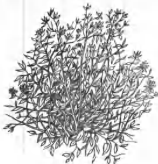
27- расм. Кийикўт.

ТОҒ МИНТАҚАЛАРИНИНГ ШИМОЛИЙ, жанубий, жануби-ғарбий ён бағирларидаги шағалли ва тошли, қўнғир тупроқли ерларда ва денгиз сатҳидан 2400 м гача бўлган баландликларда ўсади. Кийикўт маҳаллий халқларнинг севимли зираворларидан бўлиб, ундан ҳар хил таомлар ва салатлар тайёрлашда ишлатилиб келинмоқда. Кийикўтдан мева сабзавот маҳсулотларини тузлашда фойдаланиш мумкин. Кийикўт турли гўшт ва балиқ маҳсулотларини консервалашда ва вино, ликёр ишлаб чиқаришда қўлланилиши мумкин. Бу ўсимлик қорамурч ва лавр баргларидан кўра шифобахшлиги, хуштаъмлиги билан устун туради. Кийикўт халқ табobatiда юрак санчиш касалига қарши қайнатилиб ичилади. Унинг барг, поя ва тўпгулларида 0,06—2,3% гача эфир мойи бўлади. Эфир мойи оч яшил ёки сариқ, жигар ранг бўлиб, унинг таркибини ментол, ментон, пулегон, пинен ташкил этади.