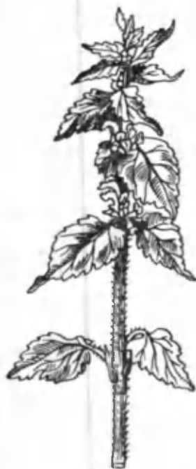
29- расм. Яснотка.

Шеролғиндан Кавказ халқлари севимли зиравор ўсимлик сифатида фойдаланадилар. Улар бу ўсимликни тархуноми билан турли овқатлар тайёрлашда фойдаланадилар. Ундан саноат аҳамиятига эга бўлган эстрагон сиркаси тайёрланади. Турли винолар ишлаб чиқаришда фойдаланса бўлади. АҚШ аҳолиси уни ўз боғларида ўстирадилар. Унинг ҳўл ва қуритилган ерустки қисмларини салатларга, ҳар хил таомларга соладилар. Бодринг, карам ва помидор тузлашда ишлатадилар. Шунингдек, конфетларга хушбўй ҳид беришда фойдаланадилар. Шеролғин халқ табобатида сийдик ҳайдайдиган ва тиш тушиши олдини олишда ишлатиладиган дори-дармонлик хусусиятига эга бўлган ўсимлик сифатида қадрланади. Тиббиётда истисқо касалликларини даволашда қўлланилади. Бу ўсимлик С витаминга, органик