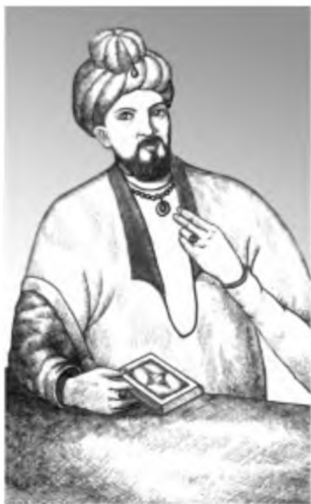
Hukmdor va alloma Abulg'oziy Bahodirxon.

1616-yili Arab Muhammadxonning o'g'illari Habash Sulton bilan Elbars Sulton ayrim qabilalarning boshliqlariga tayanib, otalariga qarshi isyon ko'tardilar. Ota farzandlariga yon bosishga majbur bo'ldi. Ular boshqaruviga topshirilgan hududlarga Vazir shahrini ham qo'shib berdi. Biroq, bu bilan nizo tugamadi. 1621-yili ular yana isyon ko'tarishdi. Bu safar otalari Arab Muhammadxon tarafida uning boshqa ikki o'g'li — Asfandiyorxon va Abulg'oziy Sulton urushda qatnashdilar. Bu urushda Habash Sulton va Elbars Sulton qo'shinlari g'olib keldi. Noqobil farzandlarning amri bilan asir olingan ota Xivaga keltirib qamab qo'yildi, keyinroq qatl etildi.