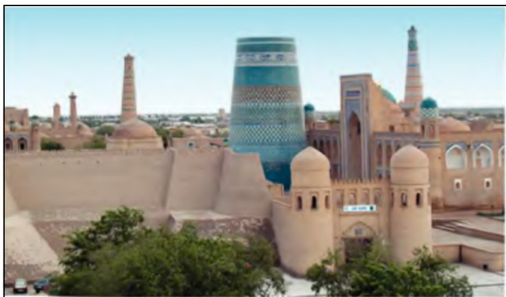
Xiva. Ichan qal'a.

Muhammad Aminxon Ichan qal'aning g'arbiy qismidagi