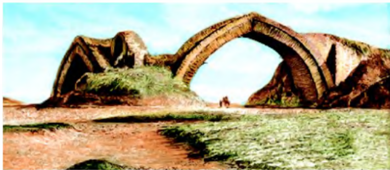
Zarafshon daryosida qurilgan ko‘prik — suv ayirg‘ich.

daryosida Karmana, Mehtar Qosim, Chahorminor, Jondor suv ayirg‘ichlari; Nurota tog‘ida Oqchob, Murg‘ob vohasida Hovuzixon suv omborlari qurilgan. Bundan tashqari, Sangzor daryosidan Jizzax vohasiga Tuyatortar kanali, Somonjuq dashtini obodonlashtirishga xizmat qilgan Xoja Ka‘ab kanali, Afshona kanali, Amudaryodan Chorjo‘yga, Murg‘obdan Marvga, Vaxshdan uning atrof vohalariga suv chiqarishga imkon beruvchi kanallar qazilgan.