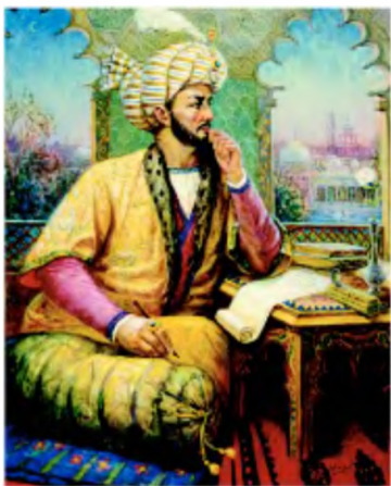
Zahiriddin Muhammad Bobur.

1510-yili Shayboniyxon halok boʻlgach, Bobur Mirzo shoh Ismoil yordamida Movarounnahrni shayboniylardan qaytarib