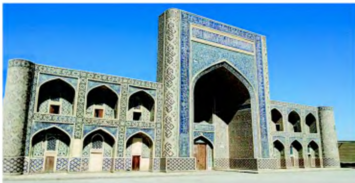
Buxoro. Abdullaxon madrasasi.

Muhammad Shayboniyxon Buxoro va Samarqandni temuriylardan so‘ng fan, madaniyat va san’at markazlari sifatida rivojlantirishga harakat qildi. Shayboniylar ta’limni rivojlantirish maqsadida islohot ham o‘tkazganlar. Bu islohotning o‘tkazilishiga