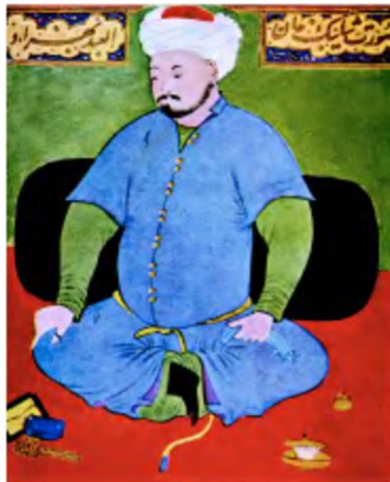
Muhammad Shayboniyxon (XVI asrda ishlangan miniatura).

Shayboniyning xizmatidan ham Mo'g'iliston, ham Movarounnahr, ham Xuroson hukmdorlari o'zlarining qo'shnilariga hamda ichki raqiblariga qarshi kurashda foydalanganlar. Bu kurashlarda Shayboniy o'zining mohir lashkarboshilik qobiliyatini namoyon qildi. Turli hukmdorlarga xizmat qilish Shayboniyga Temuriylar davlatidagi vaziyatni yaxshi bilib olishga imkon berdi.