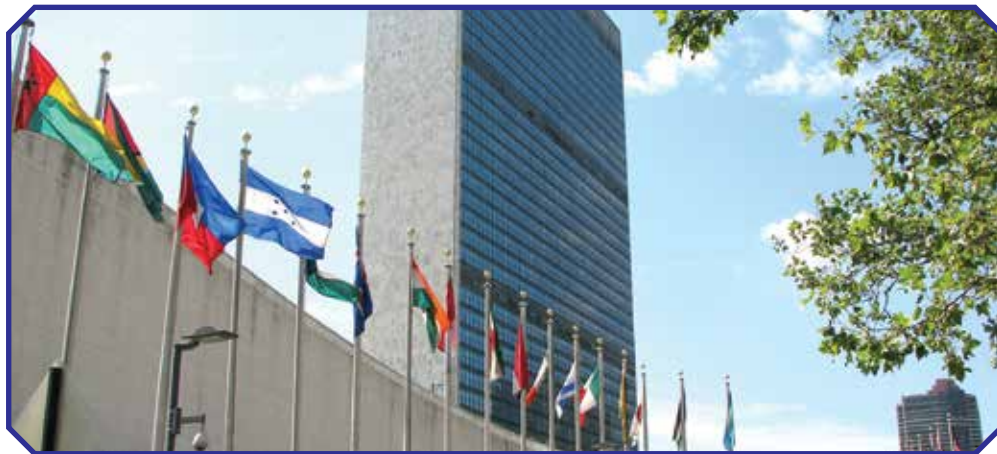
BMT shtab kvartirasi. Nyu-York

O'zbekiston BMT a'ziligiga 1992-yil 2-martda qabul qilindi. BMT bosh idorasi Nyu-Yorkda (AQSh) joylashgan.