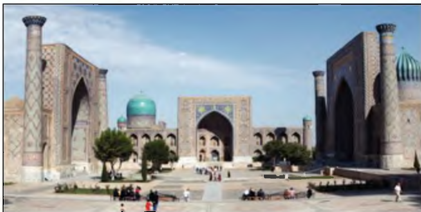
Samarqand. Registon ansambli.

XVII asrda Samarqand Registoni ansamblining hozirgi qiyofasi shakllantirildi. Samarqand hokimi Yalangto'sh Bahodir 1619 — 1635- yillarda vayrona holatiga tushib qolgan Registon maydonida Ulug'bek madrasasi qarshisida Sherdor madrasasini , uning yonida 1646 — 1660- yillarda Tillakori madrasa-masjidini o'z mablag'lari hisobidan bunyod ettirgan, unga tilladan ishlov