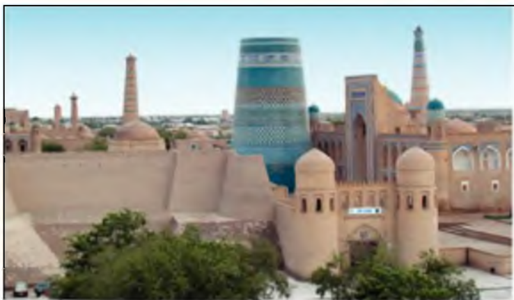
Xiva. Ichan qal'a.

Muhammad Aminxon Ichan qal'aning g'arbiy qismidagi