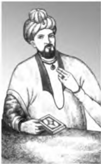
Hukmdor va alloma Abulg'oziy Bahodirxon.

1616-yili Arab Muhammadxonning o'g'illari Habash Sulton bilan Elbars Sulton ayrim qabilalarning boshliqlariga tayanib, otalariga qarshi isyon ko'tardilar. Ota farzandlariga yon bosishga majbur bo'ldi. Ular boshqaruviga topshirilgan hududlarga Vazir shahrini ham qo'shib berdi. Biroq, bu bilan nizo tugamadi. 1621-yili ular yana isyon ko'tarishdi. Bu safar otalari Arab Muhammadxon tarafida uning boshqa ikki o'g'li — Asfandiyorxon va Abulg'oziy Sulton urushda qatnashdilar. Bu urushda Habash Sulton va Elbars Sulton qo'shinlari g'olib keldi. Noqobil farzandlarning amri bilan asir olingan ota Xivaga keltirib qamab qo'yildi, keyinroq qatl etildi.