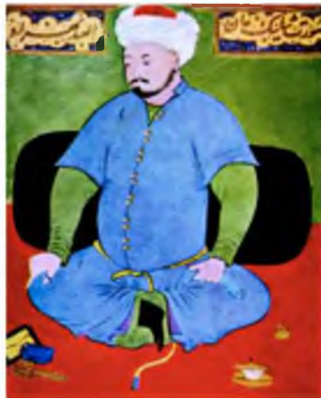
Muhammad Shayboniyxon (XVI asrda ishlangan miniatura).

Shayboniyning xizmatidan ham Mo'g'iliston, ham Movarounnahr, ham Xuroson hukmdorlari o'zlarining qo'shnilariga hamda ichki raqiblariga qarshi kurashda foydalanganlar. Bu kurashlarda Shayboniy o'zining mohir lashkarboshilik qobiliyatini namoyon qildi. Turli hukmdorlarga xizmat qilish Shayboniyga Temuriylar davlatidagi vaziyatni yaxshi bilib olishga imkon berdi.