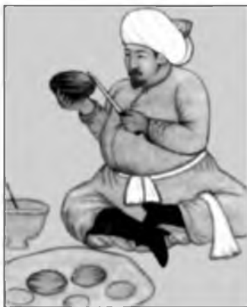
Abdullaxon II (miniatura, 1572).

Abdullaxon II Xorazm va Xurosonni Movarounnahrğa birlashtirish yo'lida ko'p jang-u jadallar olib bordi. Chunonchi, 1574 — 1595- yillar oralig'ida Balxni, Samarqandni, Toshkent va Farg'onani, Badaxshonni hamda Xorazmni zabt etdi va o'z davlati tarkibiga qo'shib oldi. Shundan keyin uning davlati sarhaddari janubda Hirotdan Mashhadgacha, shimolda Orol dengizigacha, Kaspiy dengizidan Issiqko'lgacha yetdi. Butun Movarounnahr, Xorazm va Xuroson yana yagona hukmdor qo'li ostida birlashtirildi. XVI asr oxirlariga kelib Buxoro xonligi nisbatan markazlashgan ulkan davlatga aylandi.