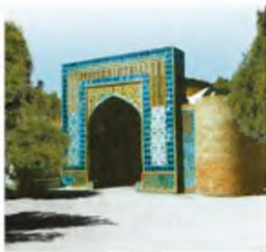
Daxmayi Shohon maqbarasi.

Umarxon Turkiston va uning atroflarini — Orolboʻyidan Yettisuvgacha egallab, Oqmachit (Qizil Oʻrda), Avliyoota (Jambul), Pishpak (Bishkek) qalʼalarini bunyod etdi. Qoʻqon va boshqa shaharlarda