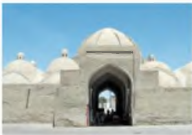
Buxoro. Toqi telpakfurushon (telpak do'koni).

Hunarmandchilik ishlab chiqarishining asosiy tarmoqlaridan yana biri — temirchilik va mis-karlik bo'lib, o'roq, pichoq, shuningdek, qurol-yarog' yasashgan. Temirchilar qilich, xanjar, oybolta, nayza, qalqon, kamon va uning o'qini yasash edilar. To'plar yasash ham yo'lga qo'yilgan. Zargarlik, kulolchilik, yog'och-