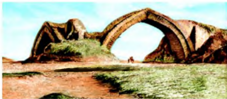
Zarafshon daryosida qurilgan ko'prik — suv ayirg'ich.

daryosida Karmana, Mehtar Qosim, Chahorminor, Jondor suv ayirg'ichlari; Nurota tog'ida Oqchob, Murg'ob vohasida Hovuzixon suv omborlari qurilgan. Bundan tashqari, Sangzor daryosidan Jizzax vohasiga Tuyatortar kanali, Somonjuq dashtini obodonlashtirishga xizmat qilgan Xoja Ka'ab kanali, Afshona kanali, Amudaryodan Chorjo'yga, Murg'obdan Marvga, Vaxshdan uning atrof vohalariga suv chiqarishga imkon beruvchi kanallar qazilgan.