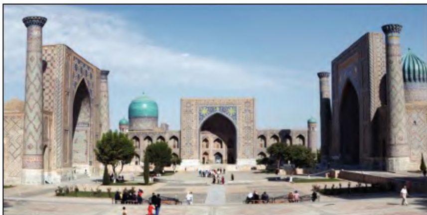
Samarqand. Registon ansambli.

XVII asrda Samarqand Registoni ansamblining hozirgi qiyofasi shakllantirildi. Samarqand hokimi Yalangto'sh Bahodir 1619 — 1635- yillarda vayrona holatiga tushib qolgan Registon maydonida Ulug'bek madrasasi qarshisida Sherdor madrasasini , uning yonida 1646 — 1660- yillarda Tillakori madrasa-masjidini o'z mablag'lari hisobidan bunyod ettirgan, unga tilladan ishlov