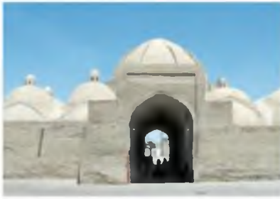
Buxoro. Toqi telpakfurushon (telpak do'koni).

Hunarmandchilik ishlab chiqarishining asosiy tarmoqlaridan yana biri — temirchilik va mis-karlik bo'lib, o'roq, pichoq, shuningdek, qurol-yarog' yasashgan. Temirchilar qilich, xanjar, oybolta, nayza, qalqon, kamon va uning o'qini yasash edilar. To'plar yasash ham yo'lga qo'yilgan. Zargarlik, kulolchilik, yog'och-