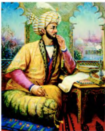
Zahiriddin Muhammad Bobur.

1510-yili Shayboniyxon halok boʻlgach, Bobur Mirzo shoh Ismoil yordamida Movarounnahrni shayboniylardan qaytarib