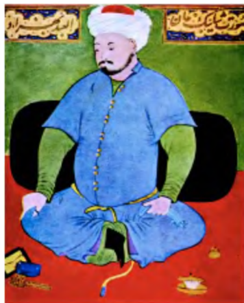
Muhammad Shayboniyxon (XVI asrda ishlangan miniatura).

Yodda tuting. Shayboniy bobosi Abulxayrxon vafotidan keyin parokanda bo'lib ketgan qabilalarni birlashtirdi va beayov qonli urushlar natijasida XV asrning 80-yillarida davlatni qayta tiklashga muvaffaq bo'ldi hamda xonlik taxtiga o'tirdi.