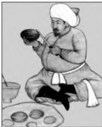
Abdullaxon II (miniatura, 1572).

Abdullaxon II Xorazm va Xurosonni Movarounnahrda birlashtirish yo'lida ko'p jang-u jadallar olib bordi. Chunonchi, 1574 — 1595- yillar oralig'ida Balxni, Samarqandni, Toshkent va Farg'onani, Badaxshonni hamda Xorazmni zabt etdi va o'z davlati tarkibiga qo'shib oldi. Shundan keyin uning davlati sarhaddari janubda Hirot dan Mashhadgacha, shimolda Orol dengizigacha, Kaspiy dengizidan Issiqko'lgacha yetdi. Butun Movarounnahr, Xorazm va Xuroson yana yagona hukmdor qo'li ostida birlashtirildi. XVI asr oxirlariga kelib Buxoro xonligi nisbatan markazlashgan ulkan davlatga aylandi.