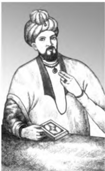
Hukmdor va alloma Abulg'oziy Bahodirxon.

1616-yili Arab Muhammadxonning o'g'illari Habash Sulton bilan Elbars Sulton ayrim qabilalarning boshliqlariga tayanib, otalariga qarshi isyon ko'tardilar. Ota farzandlariga yon bosishga majbur bo'ldi. Ular boshqaruviga topshirilgan hududlarga Vazir shahrini ham qo'shib berdi. Biroq, bu bilan nizo tugamadi. 1621-yili ular yana isyon ko'tarishdi. Bu safar otalari Arab Muhammadxon tarafida uning boshqa ikki o'g'li — Asfandiyorxon va Abulg'oziy Sulton urushda qatnashdilar. Bu urushda Habash Sulton va Elbars Sulton qo'shinlari g'olib keldi. Noqobil farzandlarning amri bilan asir olingan ota Xivaga keltirib qamab qo'yildi, keyinroq qatl etildi.