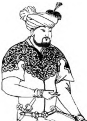
Husayn Boyqaro (Behzod tomonidan ishlangan miniatura).

Xuroson hukmdori Shohrux Mirzo 1447-yili vafot etgach, toj-u taxt uchun kurash kuchaydi. Natijada, Xuroson davlati bir necha qismlarga bo‘linib ketdi. Ularning har biri o‘zini mustaqil davlat deb hisoblar edi. 1469-yilda Amir Temurning ikkinchi o‘g‘li