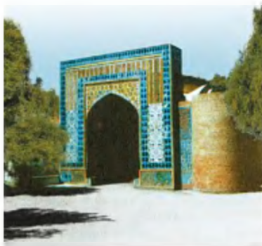
Daxmayi Shohon maqbarasi.

Umarxon Turkiston va uning atroflarini — Orolboʻyidan Yettisuvgacha egallab, Oqmachit (Qizil Oʻrda), Avliyoota (Jambul), Pishpak (Bishkek) qalʼalarini bunyod etdi. Qoʻqon va boshqa shaharlarda