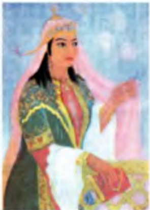
Nodira (o‘z davrida ishlangan miniatura).