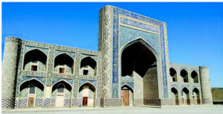
Buxoro. Abdullaxon madrasasi.

Muhammad Shayboniyxon Buxoro va Samarqandni temuriylardan so‘ng fan, madaniyat va san’at markazlari sifatida rivojlantirishga harakat qildi. Shayboniylar ta’limni rivojlantirish maqsadida islohot ham o‘tkazganlar. Bu islohotning o‘tkazilishiga