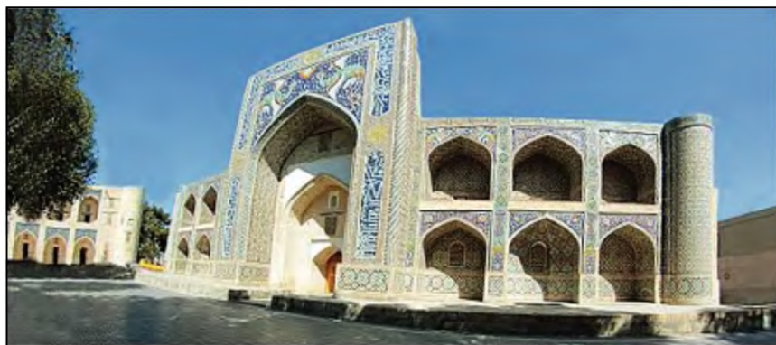
Buxoro. Nodir devonbegi madrasasi.

berish, bezash ishlari bajarilgan. Samarqand Registon ansambli o'zining rang-barang koshinkor bezaklari, naqshinkor pesh-toqlari, ulkan gumbazlari bilan Markaziy Osiyo me'morchiligining noyob tarixiy yodgorligi bo'lib, bugungi kunda jahon jamoatchiligi, sayyohlar e'tiborini o'ziga jalb qilmoqda.