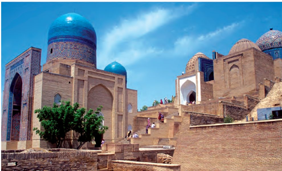
Samarqand. Shahi'zinda kompleksi

Bir waqi'tlari' Amir Temur babami'z: «Kim bizin' qu'diretimizge gu'manlansa, qurg'an imaratlari'mi'zg'a na'zer salsi'n», — dep u'lken isenim, maqtani'sh penen wo'z islerinin' ma'ngilikke tiyisli yekenin atap wo'tken yedi. Sahi'pqi'ran babami'zdi'n' aqli'g'i', ulli' dani'shpan ha'm ma'mleketlik g'ayratker Mi'rza Ulug'bek bolsa ilim tarawi'nda ashqan jan'ali'qlari' hesh qashan jog'ali'p ketpeytug'i'ni'n na'zerde tuti'p: «Wo'z isimdi mu'na'sip a'wladlari'ma qaldi'rdi'm»,