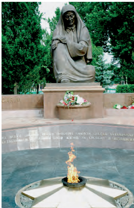
Ha'siretli ana ha'ykeli

Tashkent qalasi'ndag'i' ulli' muqa'ddes wori'nlari' tuwrali' so'z yetkende, 1999-jili' quri'lg'an Yeslew maydani'n tilge ali'w wori'nli' boladi'. Yeslew maydani'ndag'i' bir-birine qarati'p quri'lg'an nag'i's woyi'lg'an u'stinli a'ywanlardag'i' betlerde Yekinshi ja'ha'n uri'si'nda qurban bolg'an 450 mi'n' watanlaslari'mi'zdi'n' ismi-sha'ripleri alti'n ha'ripler menen jazi'p qoyi'lg'an. Bul jerden ku'ni-tu'ni ziyaratshilardi'n' qa'demi u'zilmeydi. Ha'r bir ziyaratshi' da'slep bul jerdegi Ha'siretli ana ha'ykeli aldi'na bari'p, usi' ulli' insang'a ta'zim yetedi. Keyin a'ywanlar maydani' boylap ju're woti'ri'p, wo'z wa'layati' ushi'n aji'ratilg'an betler aldi'nda toqtaydi'. Usi'