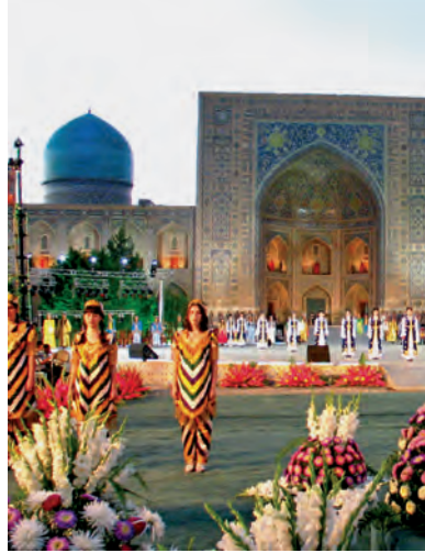
«Sharq taronalari'» xali'q arali'q muzi'ka festivali'

A'ziz woqi'wshi'! Siz a'yyemgi Samarqand haqqi'ndag'i' «Jer ju'zinin' sawlati'», «Rimnin' ten'lesi», «Sharif qala» degen ta'riplerdi yesitken boslan'i'z kerek. G'a'rez-sizlik da'wirinde wolardi'n' qasi'na jan'a ta'ripler qosi'lmaqta. Ma'selen, 2014-ji'l 7-iyulde Amerika Qurama Shtatlari'ni'n' ja'ha'ng'e belgili «Xaf-fington post» Internet basi'li'mi' Samarqandti' insan wo'z wo'miri dawami'nda hesh bolmag'anda bir ma'rte bari'p ko'riwi a'lbette za'ru'r bolg'an du'nyadag'i' 50 qalani'n' biri si'pati'nda ta'n aldi' ha'm mine usi'nday qalalar dizimine kirgizdi.