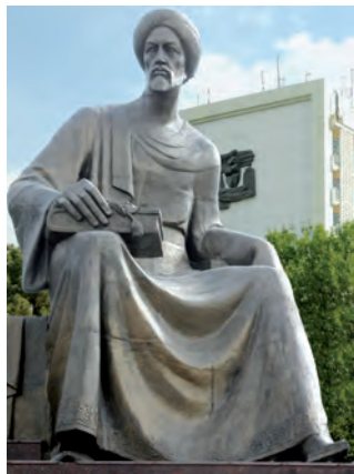
Tashkent qalasi'ndag'i' Ibn Sina ha'ykeli

Bir jigiti biytap boli'p qali'pti'. Hesh bir ta'wip woni'n' da'rtine dawa taba almapti'. Ata-anasi' aqi'ri' ulli' ha'kim Ibn Sinag'a mu'ra'jat yetipti. Ulli' dani'shpan jigittin' tami'ri'n uslap: «Usi' jaqi'n a'tiraptag'i' ma'ha'llelerdin' ati'n ayti'n», – deпти. Qanday da bir ma'ha'llenin' ati' ayti'lg'anda, jigittin' tami'r uri'wi' tezlesip ketipti. Sonda Ibn Sina ja'ne u'y iyelerine qarap: «Yendi usi'