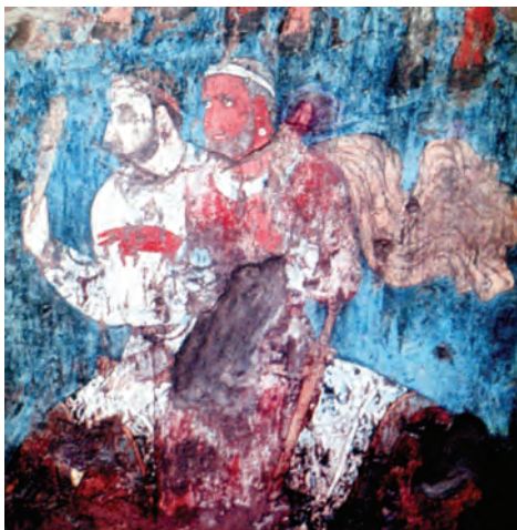
Afrasiyab to'beliginen tabi'lg'an a'yyemgi diywalg'a sali'ng'an su'wret

mine usi' ta'liyamatqa tiyisli materialli'q yesteliklerdi tawi'p, wo'z ata-babalari'ni'n' tariyxi'y yadi'ndag'i' u'zilip qalg'an baylani'slardi' tiklemekshi. Bul – haqi'yqi'y pidayi'li'q boli'p yesaplanadi'. Bul ilim janku'yeri xalqi'mi'zdi'n' bay tariyxi', a'yyemgi yestelikleri menen ma'deniy miyrasi'n' teren' u'yreniw ha'm shet yellerde u'git-na'siyatawdag'i' u'lken xi'zmetleri, O'zbekistan ha'm Yaponiya arasi'ndag'i' ilimiy baylani'slardi' rawajlandi'ri'wg'a qosqan na'tiyjeli u'lesi ushi'n ma'mleketimiz Prezidentinin' Pa'rmani' menen «Dosli'q» ordeni menen si'yli'qlandi'.