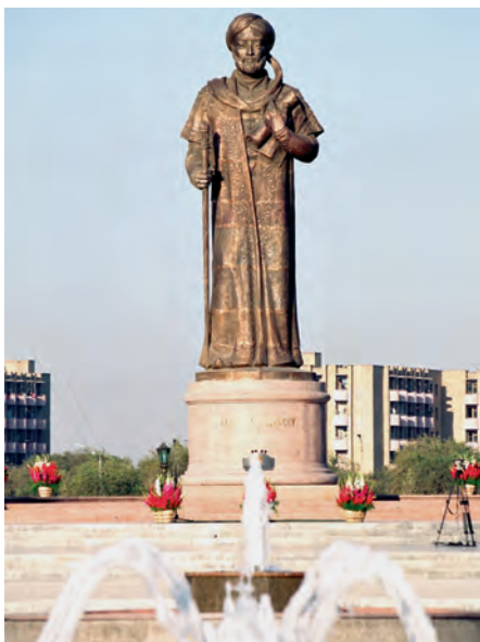
Nawayi' qalasi'ndag'i' A'liysher Nawayi' ha'ykeli

ataqli' Tretyakov galereyasi' usi'-layi'nsha payda bolg'an. Bu'gingi ku'nde ha'r qanday ma'deniyatli' adam yen' a'jayi'p su'wretlew ko'r-kem wo'neri shi'g'armalari' top-lang'an bul muzeydi ko'riwdi a'rman yetedi.