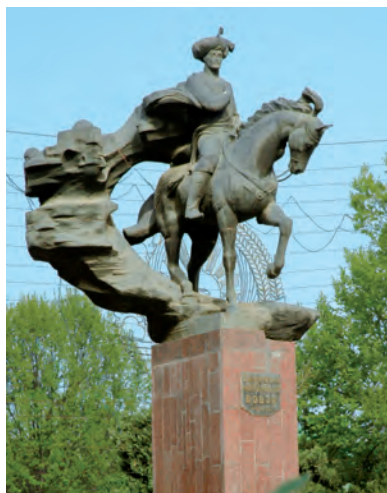
A'ndijan qalasi'ndag'i' Babur Mi'rza ha'ykeli

A'ziz woqi'wshi'! Mine usi'nday ibratli' pazi'yelletler iyesi bolg'an xali'qti'n'