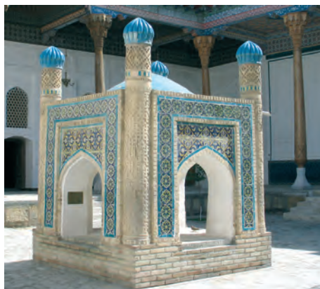
Buxara. Bahawiddin Naqshband yesteligi

Bul jag'daydi' milletimiz ma'nawiyati'ni'n' ja'ne bir a'hmiyetli belgisi bolg'an biyta'kirar arxitekturali'q yesteliklerimiz buri'ng'i' sovet da'wirinde qanshelli wayran yetilgeni mi'sali'nda da ko'riwimiz mu'mkin. Jurti'mi'zda so'vetler hu'kim su'rgen da'wirde meshit ha'm medreseler buzi'lg'an, wolar di'n' aman qalg'anlari' bolsa sklad, du'kan, ruwx'i'y kesellikler yemlewxanasi'na aylandi'ri'lg'an. A'ziz-a'wliyeleri'mi'zdi'n' qa'birleri ayaq asti' qi'li'ng'an, wolar di'n' ismleri, wo'lmes miyrasi' xalqi'