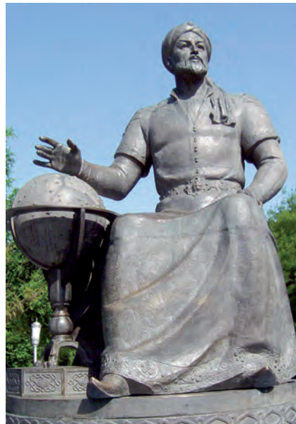
Tashkent qalasi'ndag'i' Mirza Ulug'bek ha'ykeli

Mi'rza Ulug'bekten: «Siz nege siyasattan ko're ilimgе ko'birek qi'zi'g'asi'z?» – dep sorag'anda, bi'lay dep juwap bergen yeken: «Men ilimnin' qu'diretin babamnan bildim. Bir sapari' babamni'n' dizesinde woti'r yedim. Woni'n' aldi'na bir kisi kirdi. Babam asi'g'i'p worni'nan turdi'. Men woni'n' dizesinen tu'sip kettim. Babam bug'an itibar bermesten, kelgen adamdi' ku'tip ali'wg'a asi'qti'. Keyin bilsem, wol kisi bir waqi'tlari' babama ilim u'yretken ustazi' yeken. Ali'mli'q ma'rtebesi patshali'qtan da ulli'raq yekenin sol waqi'tta bilgenmen. Sonda kewlimde ali'm boli'w ha'wesi woyang'an yedi».