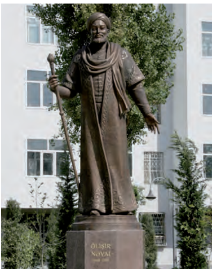
Baku qalasi'ndag'i' A'liysher Nawayi' ha'ykeli

Ja'ha'n tiltani'wshi' ali'mlari' du'nyadag'i' ulli' shayi'r ha'm jazi'wshi'lar arasi'nda yen' ko'p so'z bayli'g'i'na iye bolg'an do'retiwshini ani'qlaw boyi'nsha izertlew ju'rgizgen. Woni'n' na'tiyjesi boyi'nsha, ulli' babami'z A'liysher Nawayi' ja'ha'ndegi so'z bayli'g'i' yen' ko'p shayi'r si'pati'nda ta'n ali'ng'an. A'liysher Nawayi' wo'z shi'g'armalari'nda 26 mi'n' 35 so'z isletken yeken. Ulli' wori's shayi'ri' Aleksandr Pushkin 21 mi'n' 193, inglis shayi'ri' Uilyam Shekspir 20 mi'n'-nan aslam so'z qollang'an yeken.