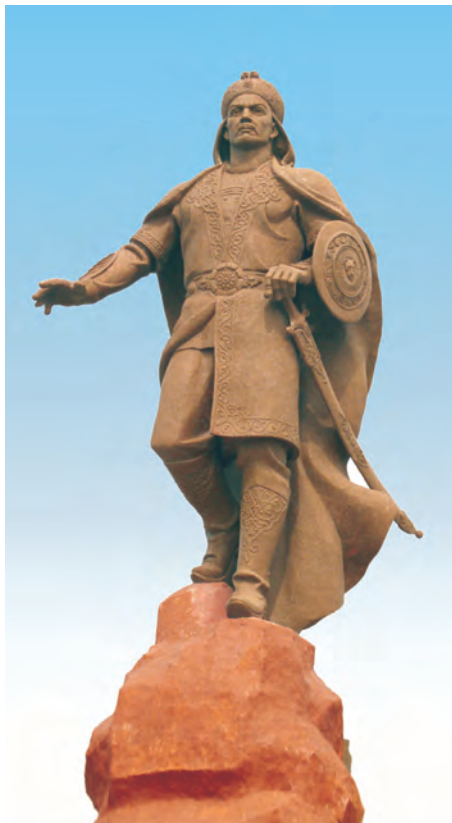
U'rgenishtegi Jalaliddin Manguberdi ha'ykeli

Ayti'wlari'na qarag'anda, sol waqi'tta ma'rt ha'm da'wju'rek Ma'werennaxr perzentinin' ruwxin' si'ndi'ri'w ushi'n Shi'n'g'i'sxan woni'n' 7-8 jasar uli'n tuti'p ali'p, wo'ltirtedi. Jalaliddin dushpan qoli'na tu'spew ushi'n son'g'i' demlerde shan'arag'i'ni'n' aldi'na kelip, wo'z perzentleri menen xoshlasadi'. Keyin ja'ne jawg'a taslani'p, wolardi' sheginiwge ma'jbu'r yetedi ha'm jag'ag'a bari'p,