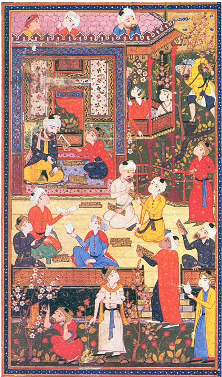
Kitobxona. Alisher Navoiy «Devon»iga ishlangan miniatyura