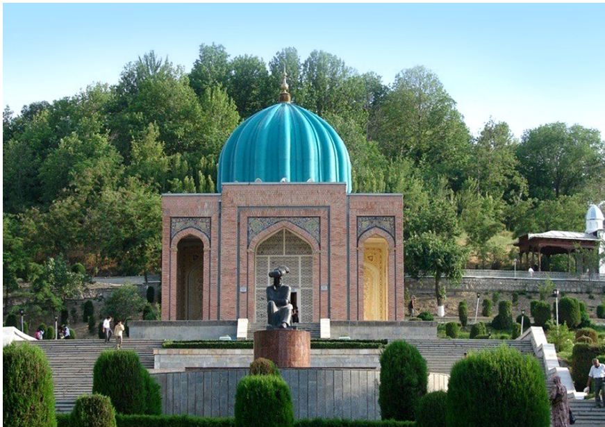
«Bobur va jahon madaniyati» muzeyi (Andijon)

1993-yil 23-dekabrda tashkil etilgan Xalqaro Bobur jamgʻarmasi Bobur ijodini oʻrganishda katta ishlarni amalga oshirdi. Jamgʻarmaning ilmiy ekspeditsiyasi 10 dan ortiq Sharq mamlakatlari boʻylab ilmiy safarlar uyushtirib, Bobur va boburiylar qadamjolari, ularning ilmiy merosiga oid yangi maʼlumotlar toʻplab, ularni ilmiy isteʼmolga kiritdi. Mazkur maʼlumotlar asosida 10 dan ziyod ilmiy, hujjatli, badiiy asarlar, 10 ga yaqin hujjatli, videofilmlar yaratildi. Jamgʻarmaning Lohur (Pokiston), Haydarobod (Hindiston), Abu Dabi (BAA), Moskva (RF), Oʻsh (Qirgʻiziston), Toshkent, Namangan shaharlarida boʻlimlari mavjud.