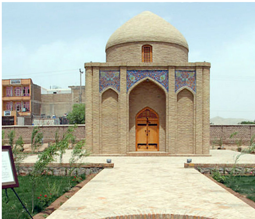
Alisher Navoiy maqbarasi (Hirot)

davr me'morchiligining go'zal obidalari sifatida bugun ham xalqimizning faxr-u iftixoriga sabab bo'lib kelmoqda.