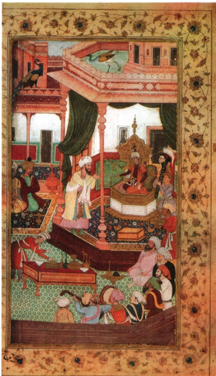
Boburning toj kiyib Farg'ona taxtiga chiqishi. «Boburnoma»ga ishlangan miniatyura