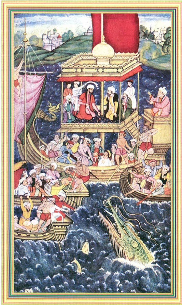
Boburning «Osoyish», «Oroyish», «Gunjoyish» va «Farmoyish» nomli qayiqlari. «Boburnoma»ga ishlangan miniatyura