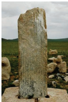
Kul Tegin bitiktoshi (Mo'g'uliston)

«To'nyuquq» bitiktoshi 2 ta ustunga yozilgan. Ularning biri 170, ikkinchisi 160 sm dan iborat. Bu yodgorlikni Yelizaveta Klemens 1897-yili Shimoliy Mo'g'ulistonda turmush o'rtog'i Dmitriy Klemens bilan birgalikda izlab topgan. Bitiktosh Ulan-Batordan 66 km janubi-sharqdagi Bain Sokto manzilida bo'lgan va hozir ham shu yerda saqlanadi.