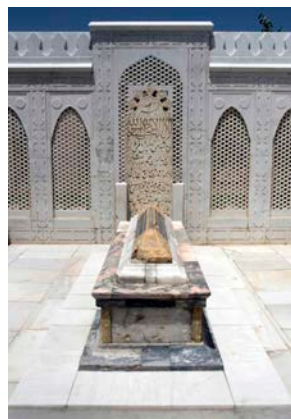
Boburning Kobuldagi maqbarasi

Bobur O‘zbekiston mustaqillikka erishganidan so‘ng o‘z yurtida haqiqiy qadr-qimmat topdi. Andijon shahrida Bobur nomida universitet, teatr, kutubxona, milliy bog‘ («Bog‘i Bobur») bor. Bobur milliy bog‘i majmuasida «Bobur va jahon madaniyati» muzeyi, shoirning ramziy qabr-maqbarasi bunyod etilgan. Shahar markazida va Bobur bog‘idagi yodgorlik majmuyida shoirga haykal o‘rnatildi. Andijondagi markaziy ko‘chalardan biriga, shuningdek, Toshkentdagi istirohat bog‘i va ko‘chaga, Andijon viloyati, Xonobod shahridagi istirohat bog‘iga Bobur nomi berildi. O‘zbekiston Fanlar akademiyasining Bobur nomidagi medali ta‘sis etildi.