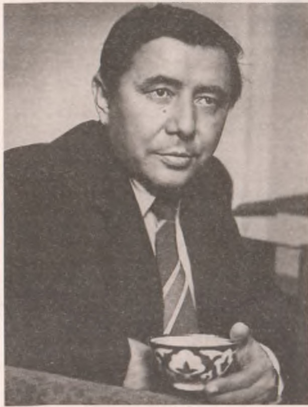
Portrait of the author, 1930s. The author is holding a bowl of tea. The author is wearing a suit and tie.