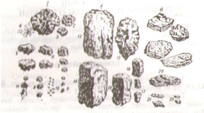
1- rasm. Tuproq strukturasi

Bu xil turdagi strukturalar o'ziga xos xususiyatlarga ega bo'ladi. Masalan, qishloq xo'jaligida suvga chidamli bo'lgan kesakchali donador (agregat holati 0,25-10 mm) struktura eng yaxshi hisoblanadi. Chunki bu holdagi struktura elementlari yerni ishlagan, sug'organ va yomg'ir yoqqan vaqtida har xil mexanikaviy va fizik-kimyoviy jarayonlarning salbiy ta'siriga chidaydi, tezda parchalanib, to'zonlanib ketmaydi va uzoq muddat o'zining donadorlik holatini saqlab turadi.