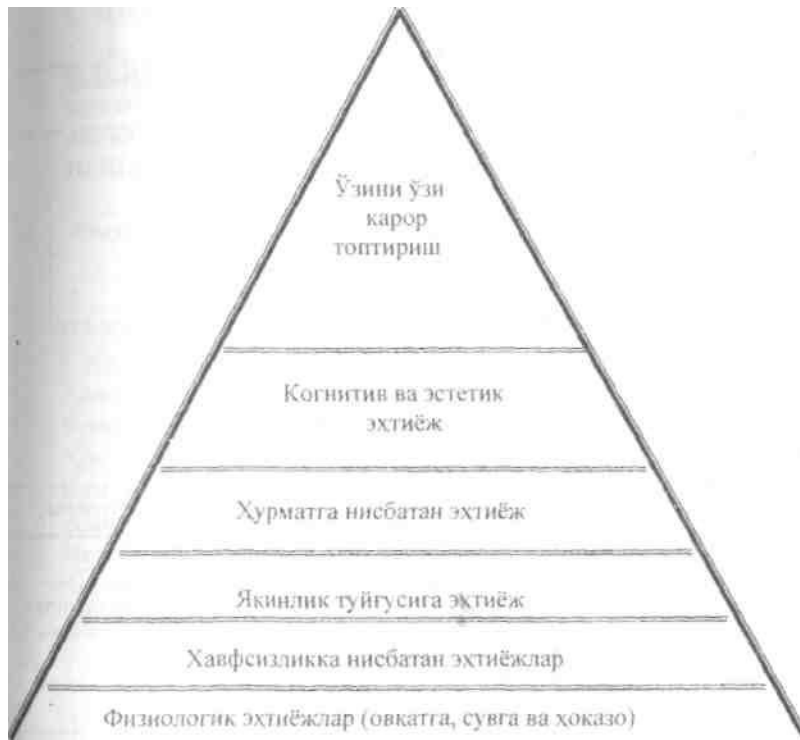
А. Маслоу пирамидаси