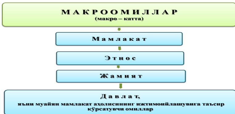
2-расм. Юқори синф ўқувчиларига таъсир этувчи макроомиллар тизими.

- юқори синфларда ижтимоий фанлар доирасидаги таълимни ижтимоий педагогик лойиҳалашнинг назарий ва амалий муаммоларига доир илмий-методик тавсиялар ишлаб чиқилиши ва тадқиқот якунлари бўйича мустақил илмий хулосалар чиқарилиб, ўқув қўлланмалар яратилиши бўйича тавсиялар ишлаб чиқишни талаб қилади. 2-расмда юқори синф ўқувчиларига таъсир этувчи макроомиллар келтирилган.