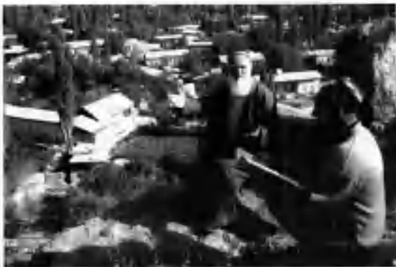
Маърифатпарвар, тажрибали, ватанга содиқ инсон Султонали Болтаев китоб муаллифи билан ҳаёт тажрибалари ҳақида суҳбатлашмоқда.