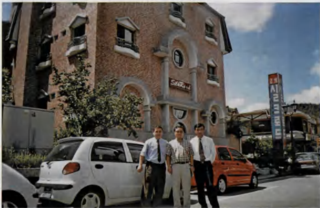
Вакилларимиз Жанубий Кореяда.