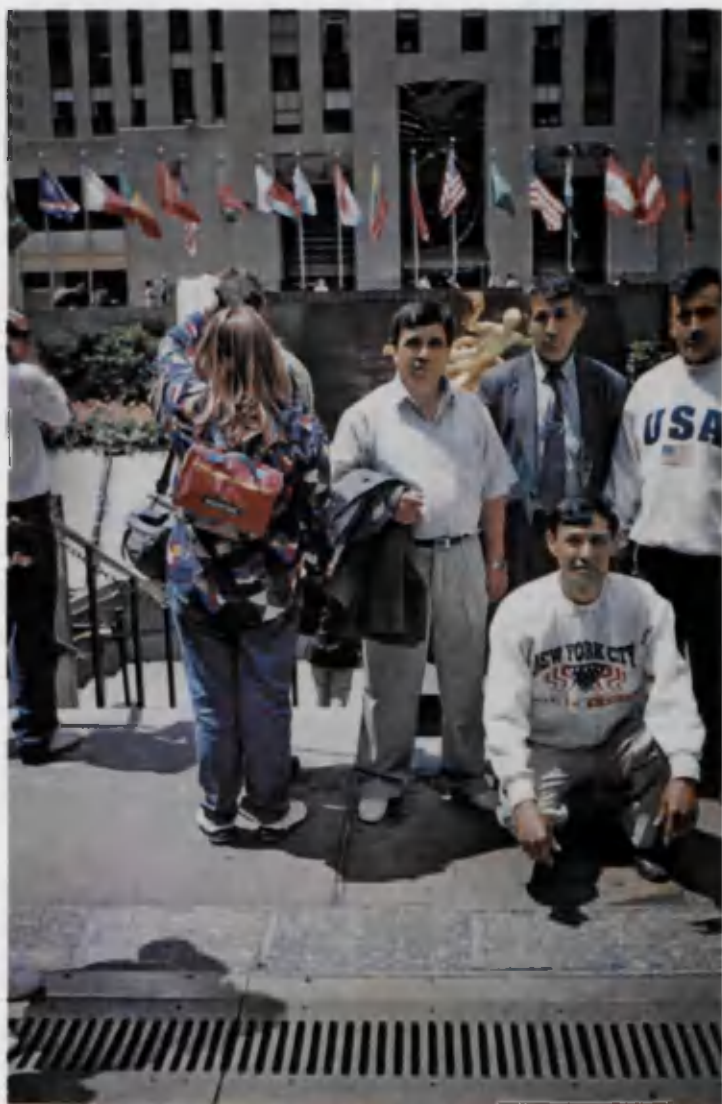
Олимларимизнинг АҚШга сафари.