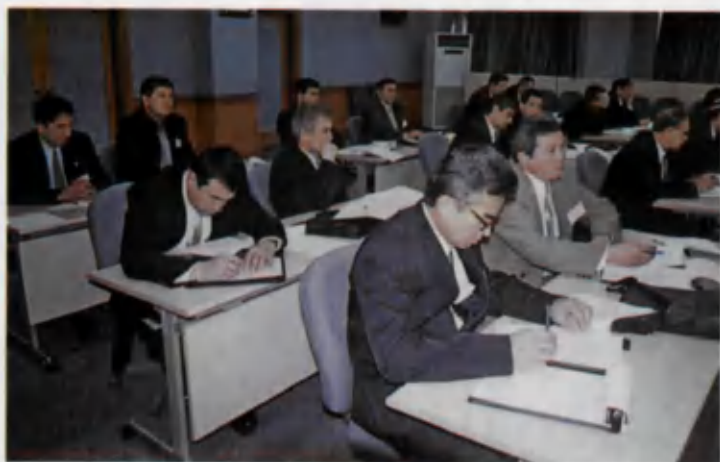
Навбатдаги анжуманлардан бири.