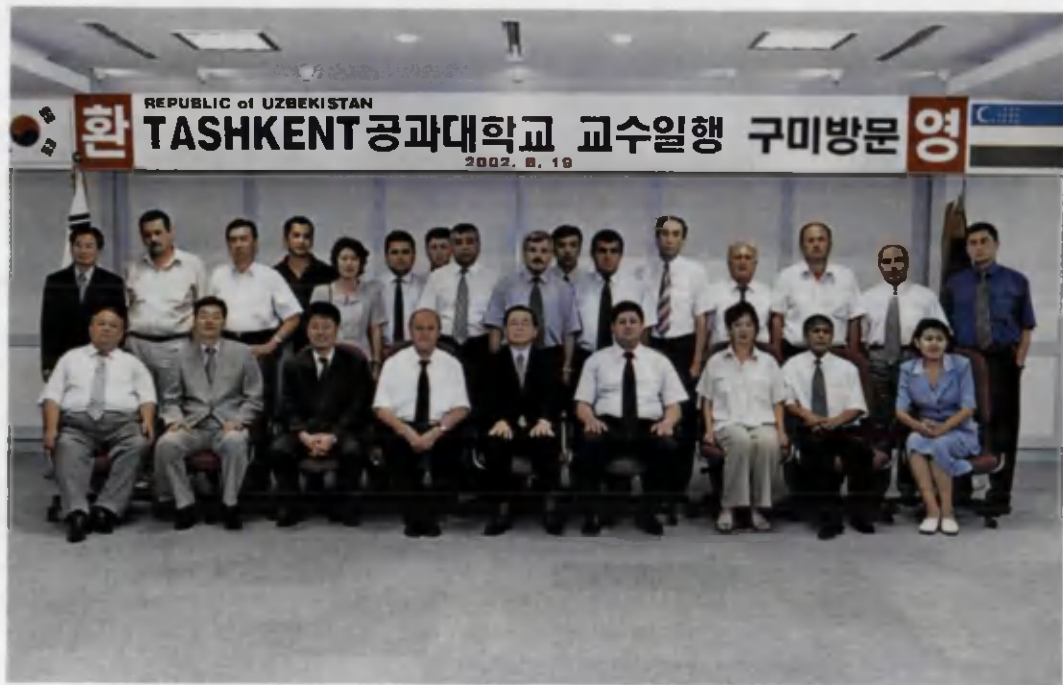
Олимларимиздан бир гуруҳи Жанубий Корея элчихонасида.