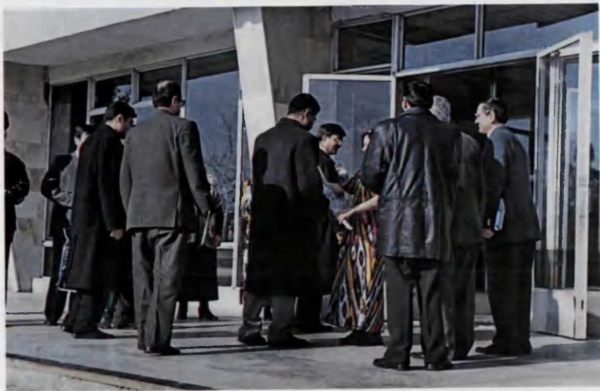
Хорижлик меҳмонларни кутиб олиш пайти.