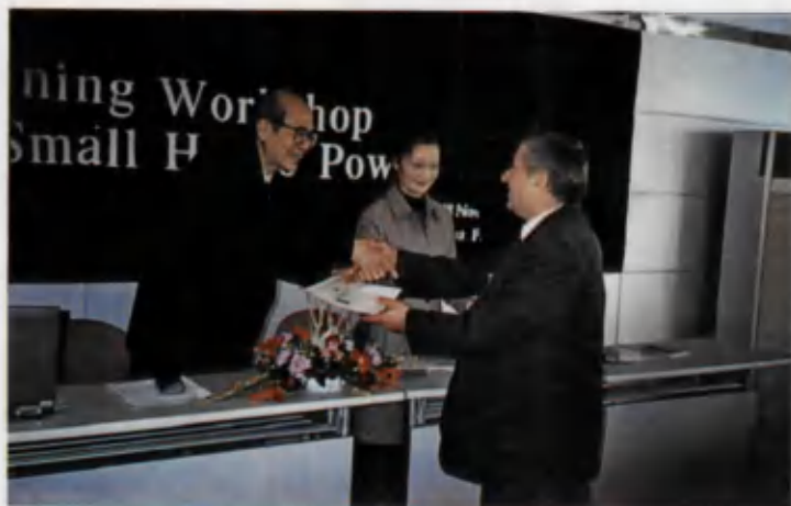
Хитой Халқ Республикасида бўлиб ўтган илмий анжуманда сертификат топширилмоқда.