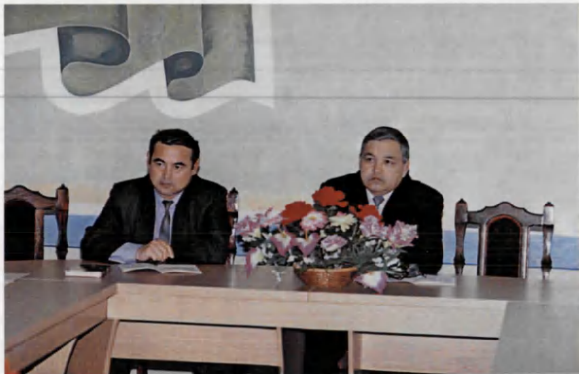
Институт илмий анжуманида.