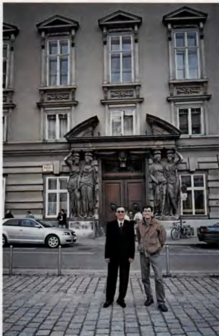
Ҳамиша гўзал ва навқирон Вена шаҳрида (Австрия).