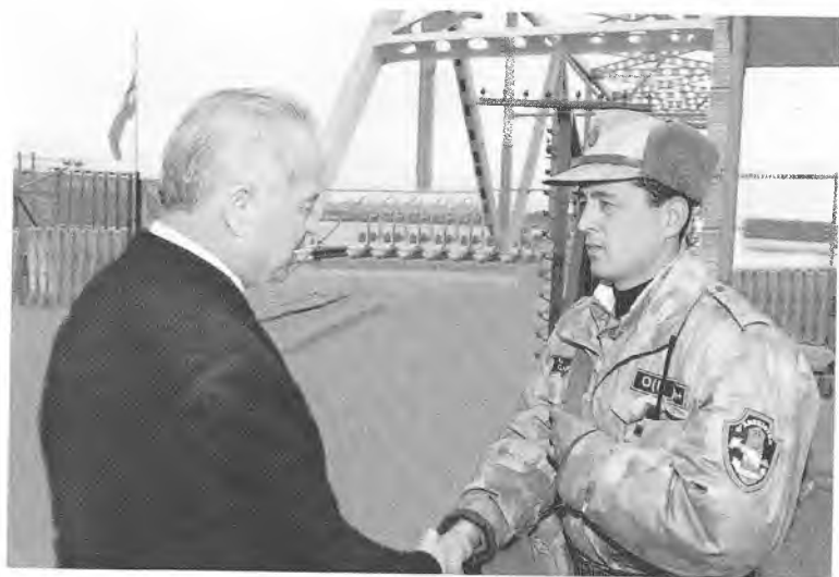
Сарҳадларимиз ҳимояси ишончли қўлларда