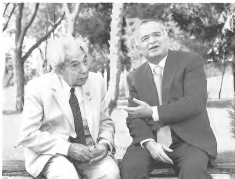
«Адабиётимиз бахтига омон булинг...»