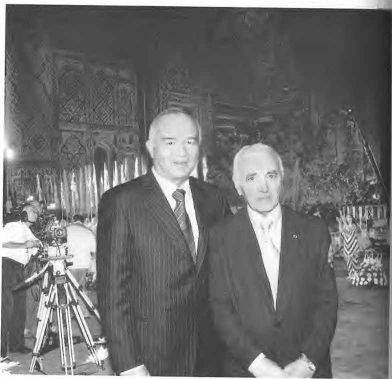
Шарль Азнавур: «Ёшликдаги орзуим ушалди – Самарқандни куриш бахтига муяссар булдим!»