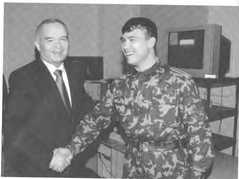
«Туйга айтиш эсдан чиқмасин, курсант!»