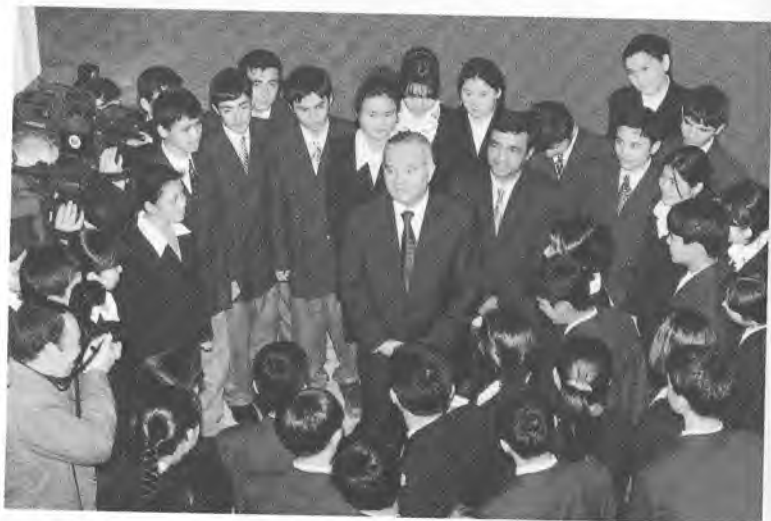
«Доимо юксак мақсадларга интилиб яшанг...»