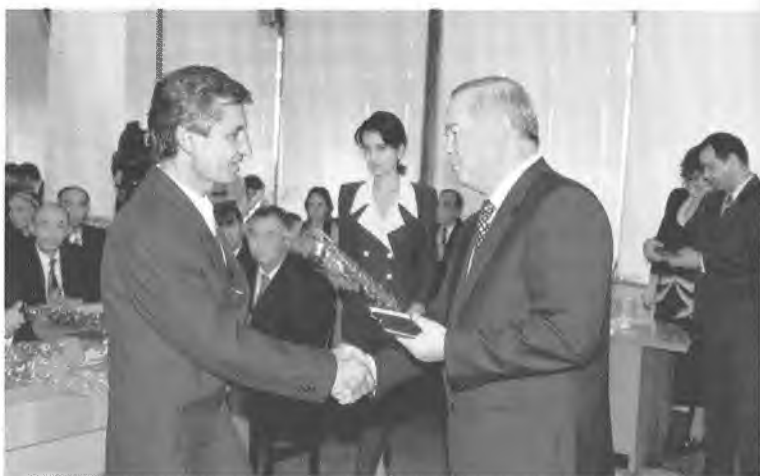
«Муҳаммаджон, яши шеърларингиз купайсин».