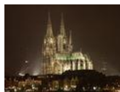
Кёльнский собор , Кёльн ( Северный Рейн — Вестфалия )