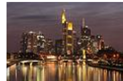
центр города Франкфурт-на-Майне