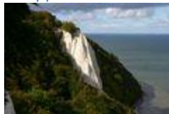
Меловая скала на о. Рюген ( Мекленбург-Передняя Померания )