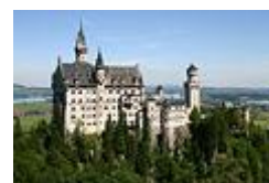
Королевский замок Нойшванштайн ( Бавария )