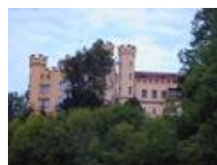
Королевский замок Хоэншвангау ( Бавария )