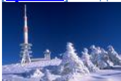
вершина Броккен в горном массиве Гарц ( Саксония-Анхальт )