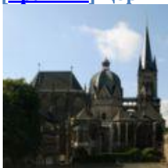
Аахенский собор , Аахен ( Северный Рейн — Вестфалия )