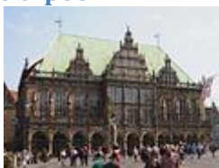
Бременская ратуша ( Бремен )