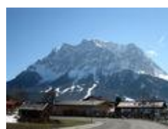
вершина Цугшпитце в Альпах ( Бавария )