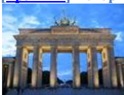
Бранденбургские ворота ( Берлин )