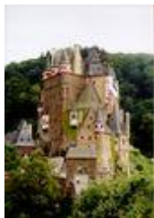
Замок Эльц на Мозеле ( Рейнланд-Пфальц )