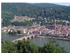
Гейдельбергский замок , Гейдельберг ( Баден-Вюртемберг )