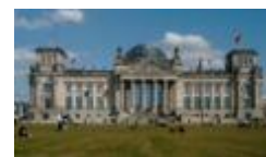
Рейхстаг ( Берлин )