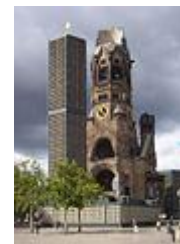
Мемориальная церковь кайзера Вильгельма , Берлин