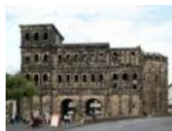
Порта Нигра , Трир ( Рейнланд-Пфальц )