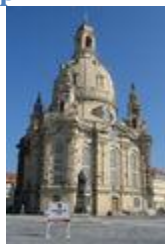
Фрауэнкирхе , Дрезден ( Саксония )